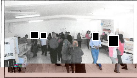
Sección 1194, casillas B, C1, C2, C3