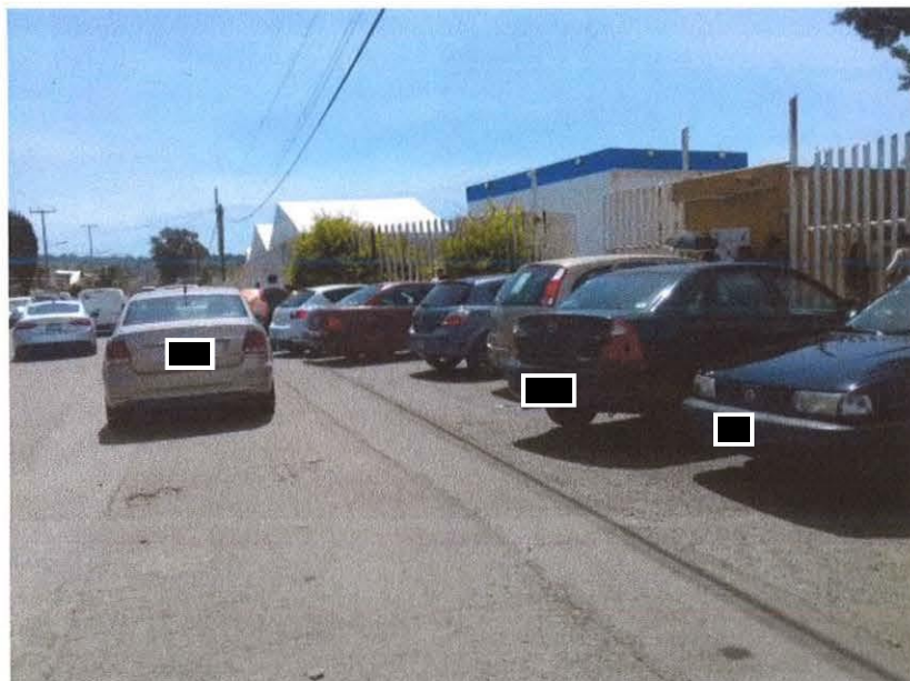
Afuera de la Jurisdicción Sanitaria no. 6, lugar de instalación de las casillas para la sección 1565.