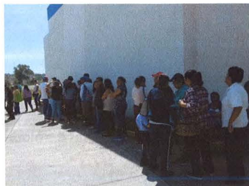
Votación a las 11:14 am.