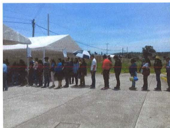
Votación a la 01:07 pm.