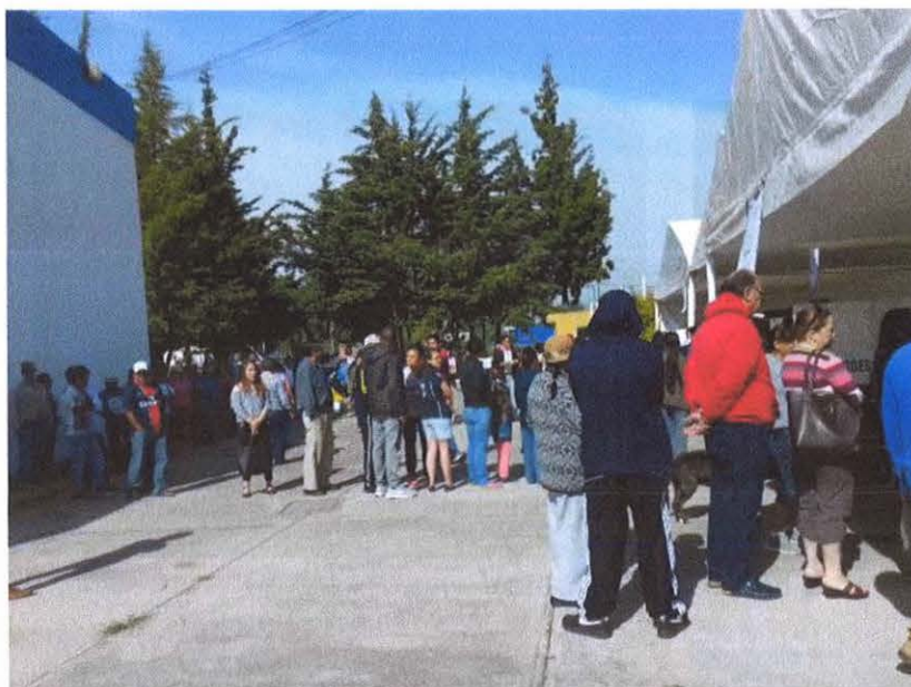
Votación a las 09:59 am.