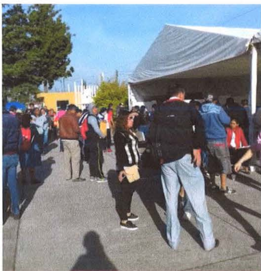
Apertura de casillas.

Casillas de la sección 1565. a) Básica y C1; b) C2 y C3; c) C4.