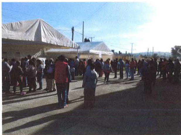
Votación a las 09:11 am.