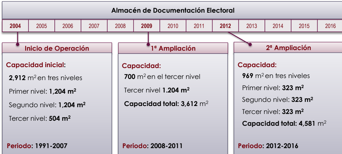
Figura 4. Evolución de la capacidad del archivo de resguardo documental del CECYRD.

En la figura 4 se muestra de manera esquemática la evolución de la capacidad del almacén de resguardo documental.