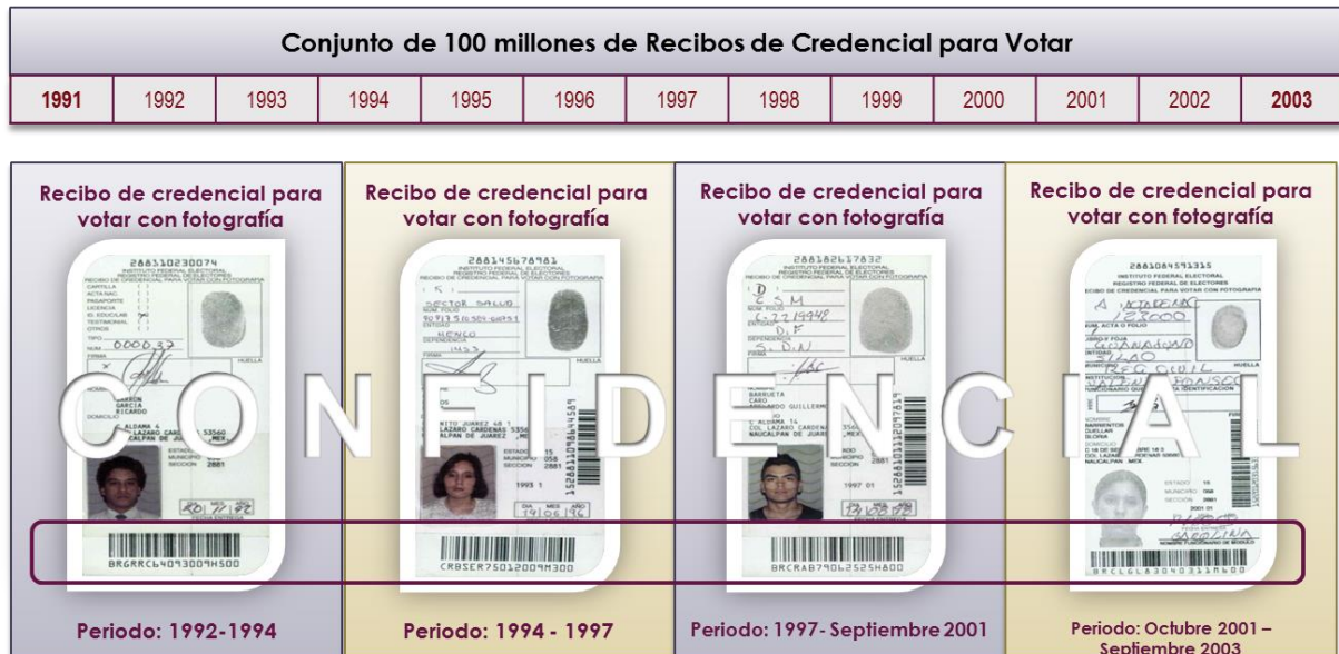
Figura 2. Tipos de Recibos de Credencial generados en el modelo operativo descentralizado.

Cabe mencionar que, la totalidad de los documentos generados en el marco del modelo operativo descentralizado no contaba con los elementos de anclaje que se utilizan para los procesos automatizados de digitalización.