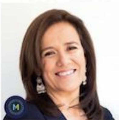
MARGARITA ESTER ZAVALA GÓMEZ DEL CAMPO