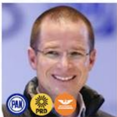
RICARDO ANAYA CORTÉS