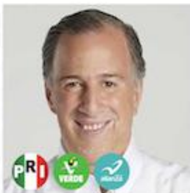
JOSÉ ANTONIO MEADE KURIBREÑA