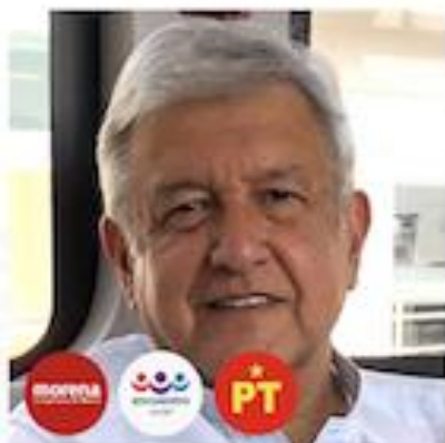
ANDRÉS MANUEL LOPEZ OBRADOR