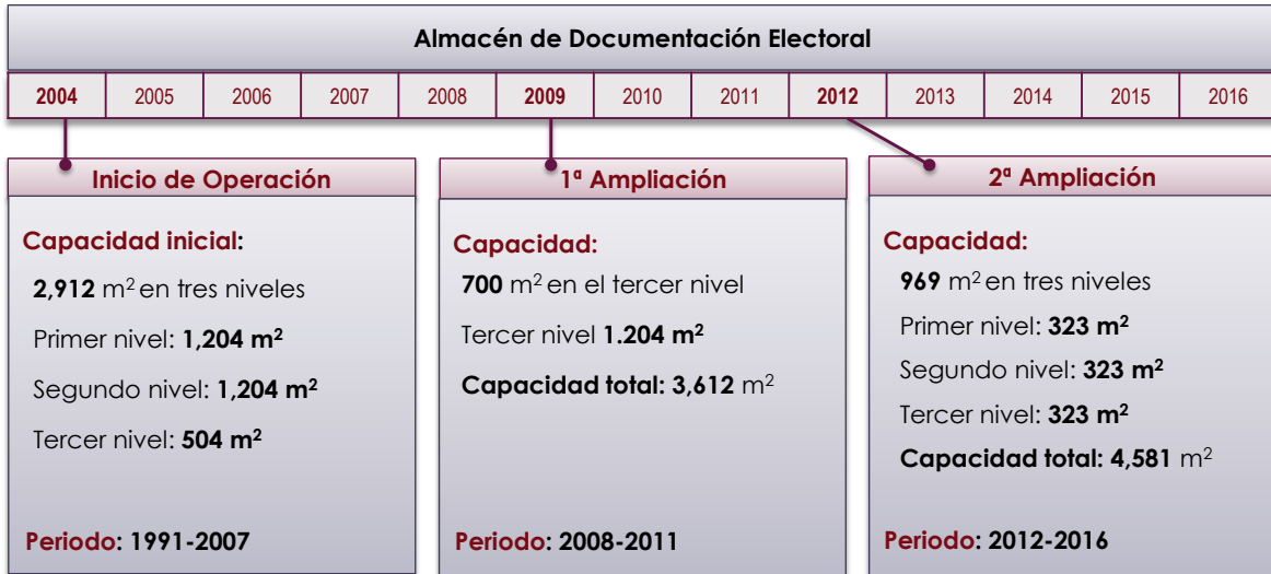
Figura 4. Evolución de la capacidad del archivo de resguardo documental del CECYRD.

En la figura 4 se muestra de manera esquemática la evolución de la capacidad del almacén de resguardo documental.