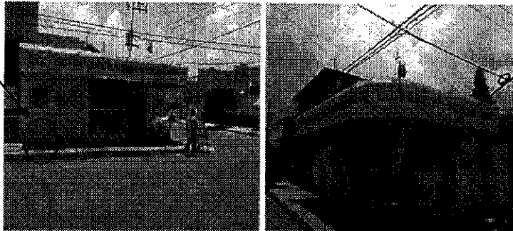
a) Calle Hermenegildo Galeana, esquina con Mariano Matamoros, colonia Loma Bonita;

2.- En el domicilio ubicado en Avenida 5 de Mayo, esquina con Benito Juárez, colonia Constitución de 1857, en Nezahualcóyotl, Estado de México, se hizo constar que se encontraba pintada la fachada de la tortillería de color blanco y amarillo con el emblema del PRD, con una pinta que da hacia el frente de la Avenida Cinco de Mayo, que dice: PRD, Tortillas a bajo costo en apoyo a su economía familiar , y en el interior, se observa una pinta que dice: CNC ¡En apoyo a su Economía! , como se ve a continuación: