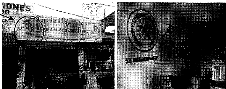
b) Avenida 5 de Mayo, esquina con Benito Juárez, colonia Constitución de 1857;

2.- En el domicilio ubicado en Avenida 5 de Mayo, esquina con Benito Juárez, colonia Constitución de 1857, en Nezahualcóyotl, Estado de México, se hizo constar que se encontraba pintada la fachada de la tortillería de color blanco y amarillo con el emblema del PRD, con una pinta que da hacia el frente de la Avenida Cinco de Mayo, que dice: PRD, Tortillas a bajo costo en apoyo a su economía familiar , y en el interior, se observa una pinta que dice: CNC ¡En apoyo a su Economía! , como se ve a continuación: