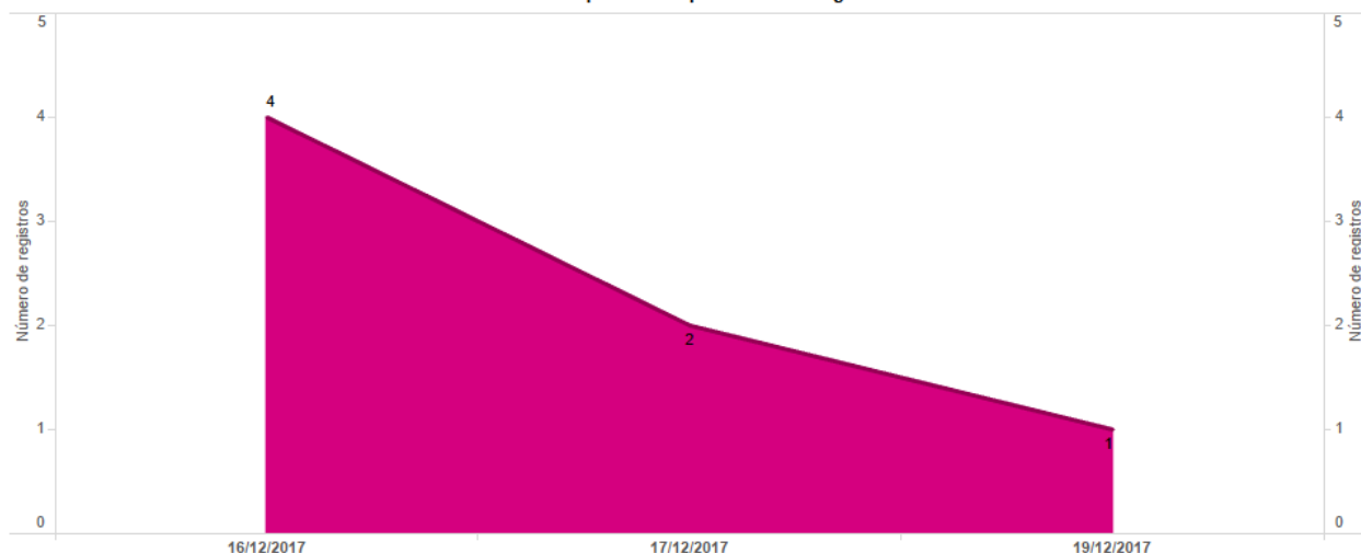
Total de Operaciones por Fecha de Registro