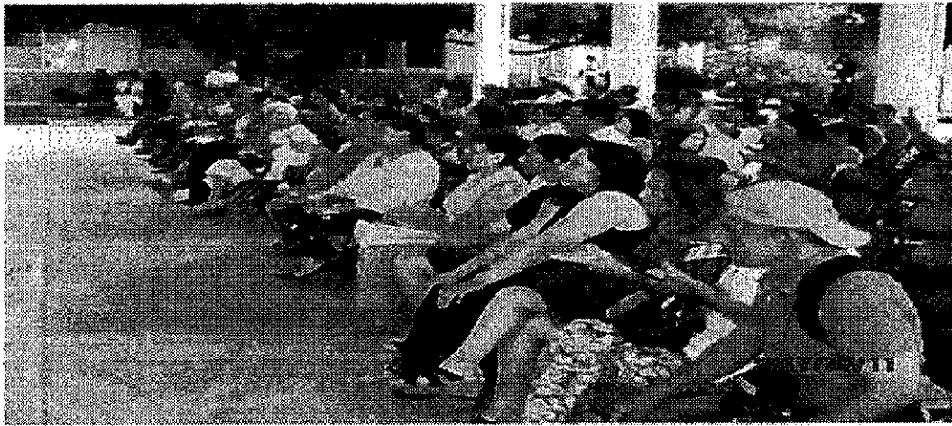
Asistentes al evento

El veinticuatro de octubre de dos mil diecisiete, mediante Acuerdo la Unidad Técnica de Fiscalización solicitó al Vocal Ejecutivo del Estado de Veracruz del Instituto Nacional Electoral, se constituyera en la escuela secundaria y bachillerato “Lic. Marco Antonio Muñoz”, a fin de solicitar información complementaria a la Directora de la escuela referida, en relación a los hechos investigados en el procedimiento de mérito, debiendo dicha Directora, tener un acercamiento con los padres de familia o tutores presente el día del evento, se identifique a los beneficiarios de los regalos y se les requiera e estos las características específicas (marca y modelo) y, de ser posible fotos de cada uno de los obsequios que presuntamente fueron donados por los incoados en el marco celebrado por el día de las madres, así como el listado de padres de familia (nombre, domicilio y teléfono), de los distintos grados estudiantiles que conformaron el alumnado al día once de mayo de dos mil diecisiete.