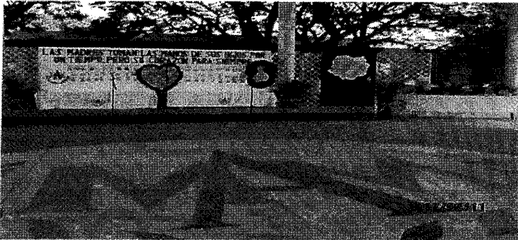
Mampara y mesa de regalos.

Asimismo, la Directora de la escuela secundaria y bachillerato “Lic. Marco Antonio Muñoz”, en su escrito de desahogo de información adjunto fotos, de las cuales se considera oportuno destacar, las siguientes: