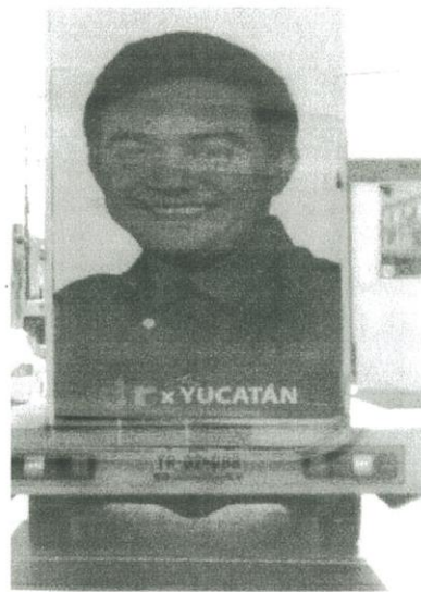
Fotografías de la propaganda móvil fijada en vehículo automotor placas YR-02-988.

En la imagen, únicamente se puede apreciar la parte trasera del espectacular móvil, destacándose la imagen del denunciado, con una franja inferior que contiene la leyenda “ dar x YUCATÁN ”.