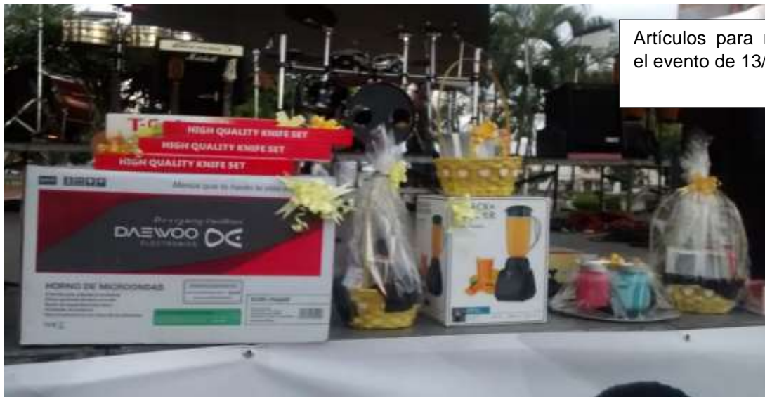
Artículos para rifa, durante el evento de 13/01/2016

* Imagen visible en la página 3 del acta circunstancia instrumentada por el personal de la Unidad de Fiscalización y 136 del expediente.