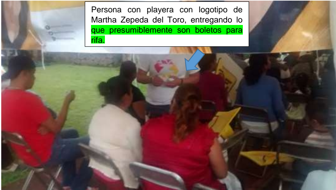
* Imagen visible en la página 22 del acta circunstancia instrumentada por el personal de la Unidad de Fiscalización y 136 del expediente.