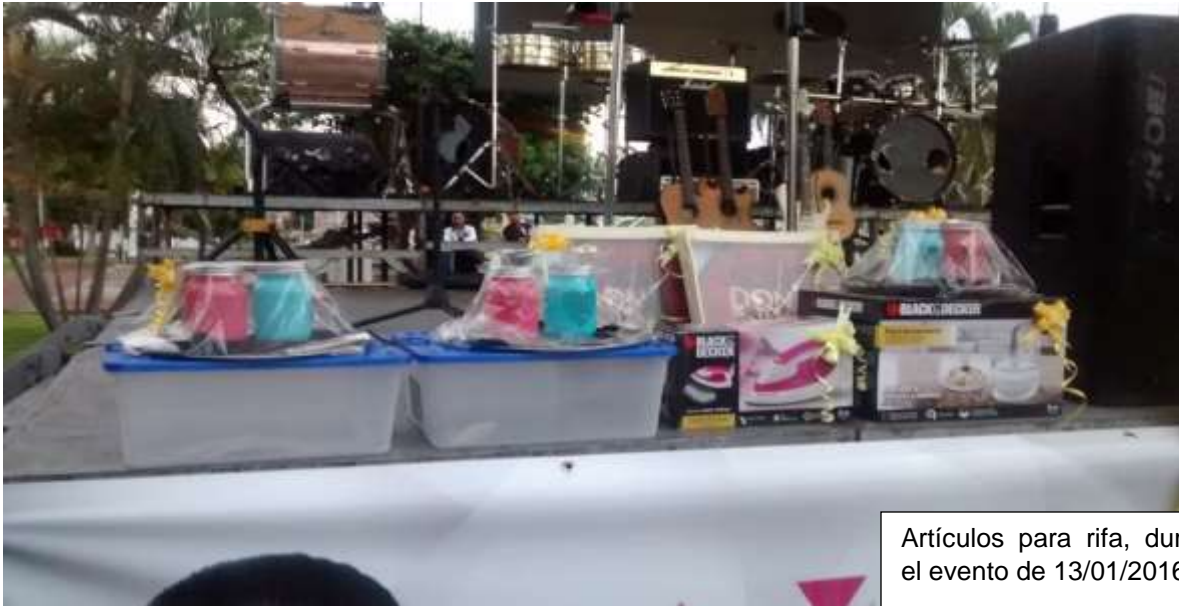
Artículos para rifa, durante el evento de 13/01/2016

* Imagen visible en la página 3 del acta circunstancia instrumentada por el personal de la Unidad de Fiscalización y 136 del expediente.