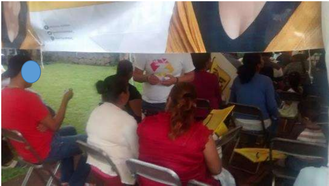
* Imagen visible en la página 22 del acta circunstanciada instrumentada por el personal de la UTF y 136 del expediente.