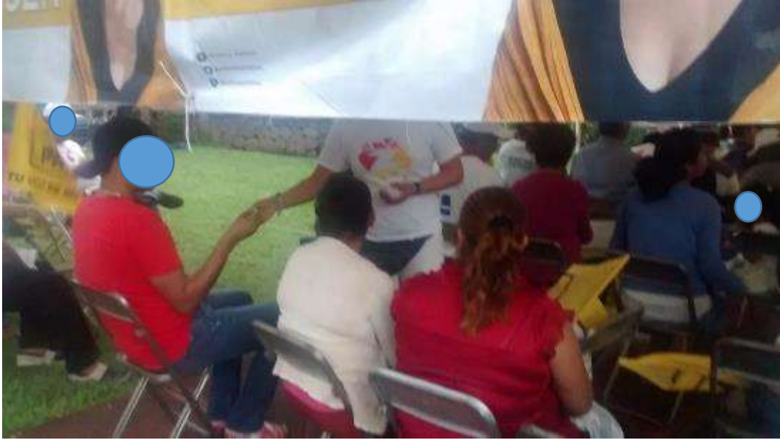
* Imagen visible en la página 21 del acta circunstanciada instrumentada por el personal de la UTF y 154 del expediente.