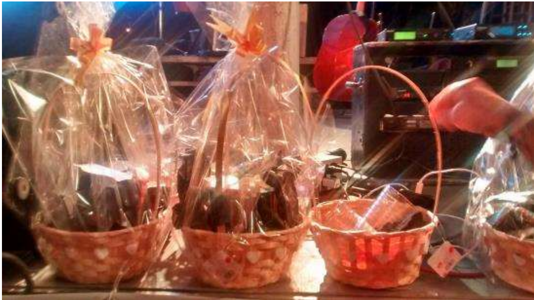
* Imagen visible en la página 26 del acta circunstanciada instrumentada por el personal de la UTF y 158 del expediente.