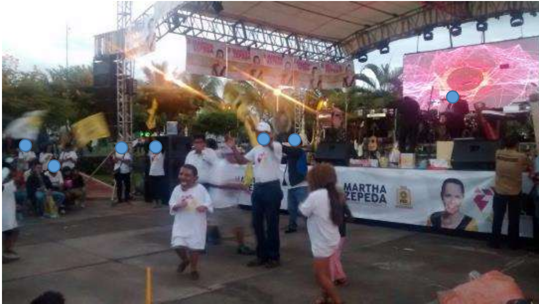
* Imagen visible en la página 23 del acta circunstanciada instrumentada por el personal de la UTF y 155 del expediente.