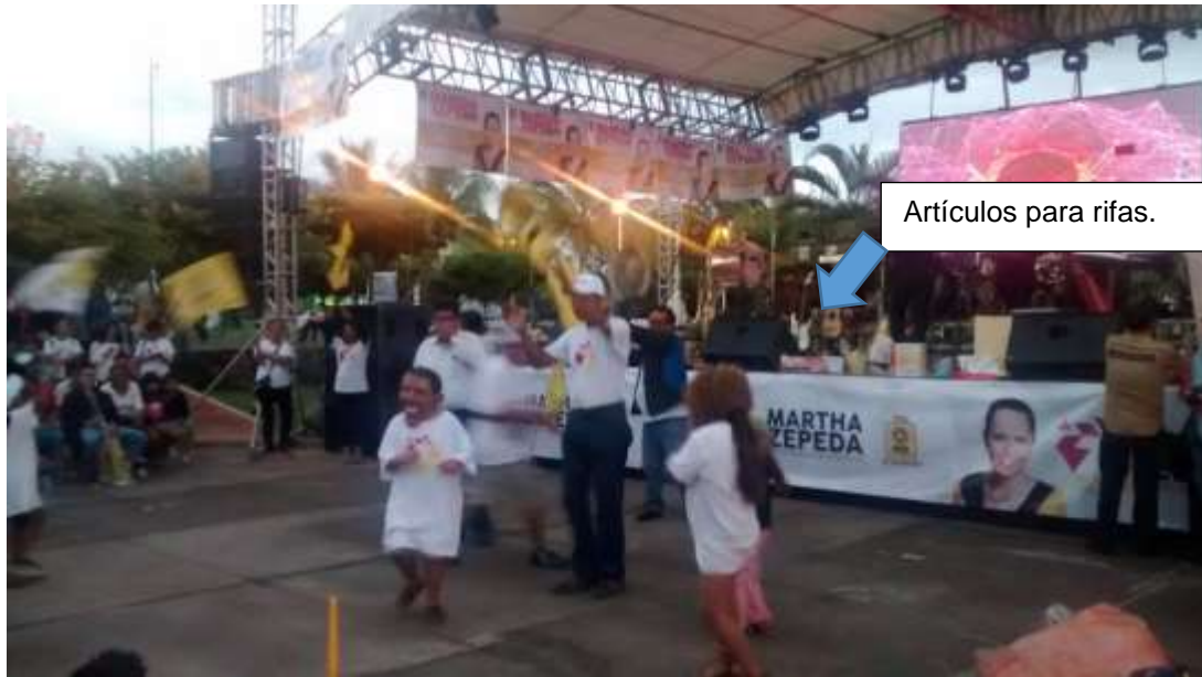
* Imagen visible en la página 23 del acta circunstancia instrumentada por el personal de la Unidad de Fiscalización y 155 del expediente.