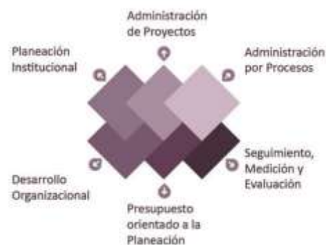
Representación gráfica del Sistema Integral de Planeación, Seguimiento y Evaluación Institucional

El Sistema Integral de Planeación, Seguimiento y Evaluación Institucional 1 (SIPSEI), marco de la planeación institucional, tiene como fin aportar una visión integral de gestión, favoreciendo el uso racional de los recursos institucionales en un entorno de transparencia y rendición de cuentas. A continuación se presentan los seis componentes del SIPSEI: