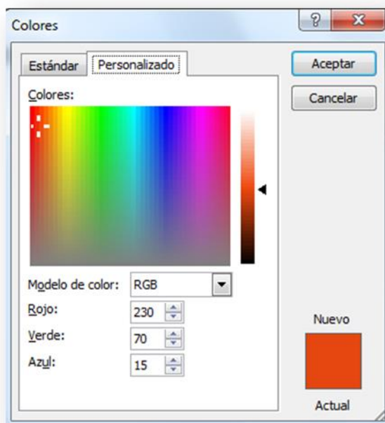
* Fig.1. Ejemplo en Word para obtener el color en formato decimal y su posterior conversión hexadecimal