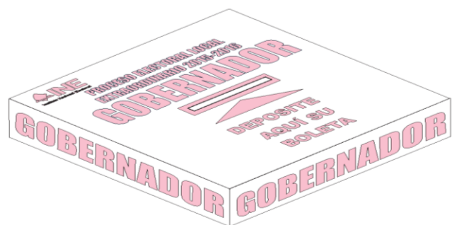
FORRO PARA URNA