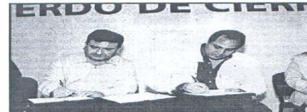
EL PROCURADOR AGRARIO Y EL GOBERNADOR SIGNAN EL DOCUMENTO