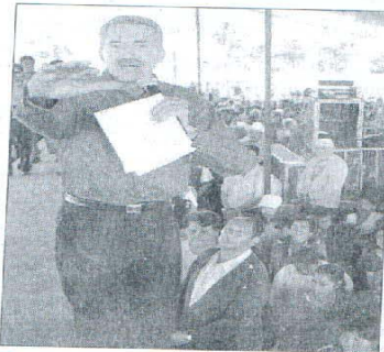
Reportan varios altercados durante los eventos proselitistas de Roberto Madrazo.

"Porque soy maestra y soy madre, y por eso primero están los niños de Puebla, estoy muy