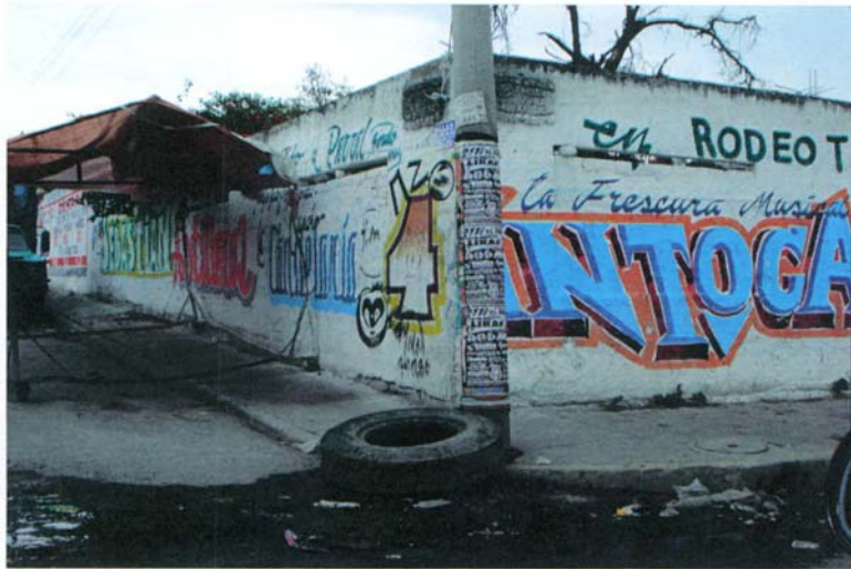
AVENIDA JUAREZ ENTRE CALLE SAN JUAN Y AV. COZAMALOC