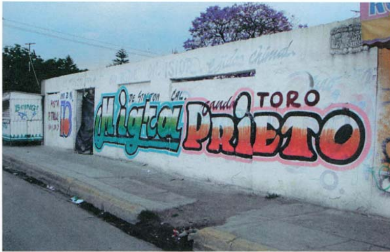
AV. ORG. POPULAR, ESQ. C. TOMACATL (FRENTE DPTVO.HERREROS)