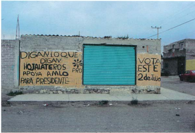
AV. SINDICALISMO ESQ. C. YAUTLI