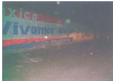
Fotografía número 8