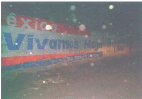
Fotografía número 1