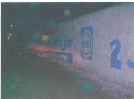
Fotografía número 3