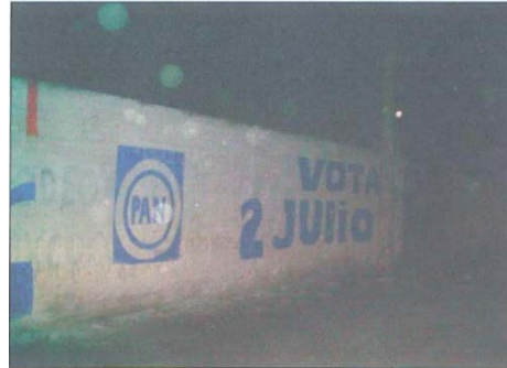
Fotografía número 6