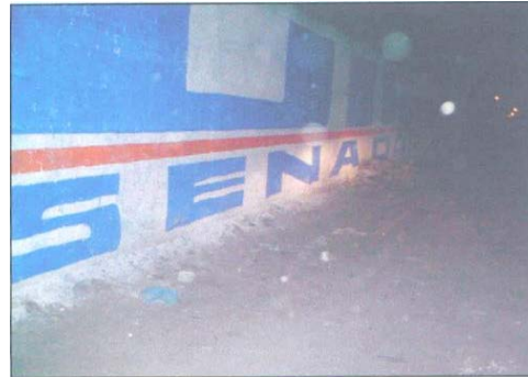
Fotografía número 12