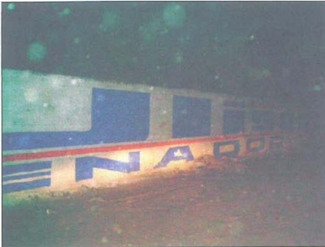
Fotografía número 11