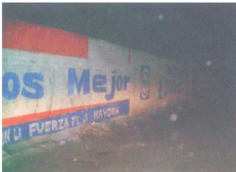
Fotografía número 7