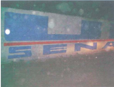
Fotografía número 5