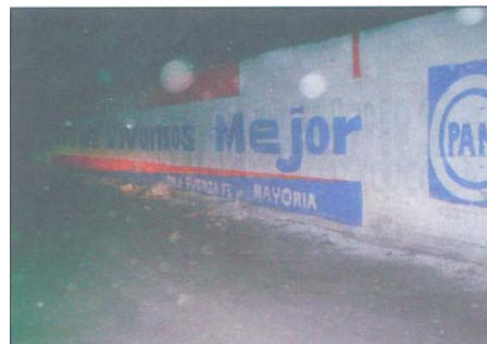
Fotografía número 2