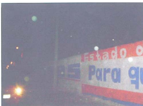
Fotografía número 9