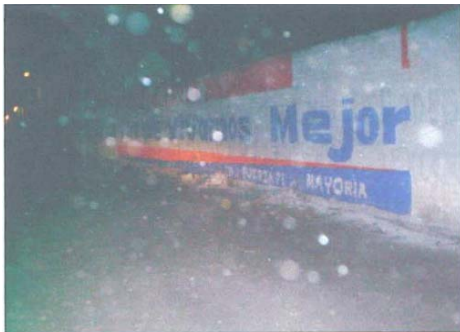
Fotografía número 13