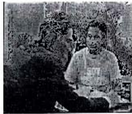
(Fotograma capítulo 216 transmitido el día 22 de junio de 2009)

2. Los días 21, 22 y 23 de junio de 2009 en el canal 2 con clave ‘XEW-TV-2’ (canal de las estrellas), de la empresa Televisa, S.A. de C.V., en las escenas de la telenovela denominada ‘Un gancho al Corazón’ (capítulo 215 ‘ESCOGE’ duración 37:30; 216 ‘CRUEL REALIDAD’ duración 41:35 y el capítulo 217 ‘VENENO’ con una duración: 00:39:15) que se transmite de lunes a viernes a las 20:00 horas se presenta al actor Raúl Araiza con camisetas con la leyenda ‘SOY VERDE’, utilizando la misma tipografía y pantone (sic) combinación de colores verde y blanco del emblema y propaganda del Partido Verde Ecologista de México, como se puede apreciar en las siguientes imágenes tomadas de la página de internet http://www.tvolucion.com/telenovelas/romantica/un-gancho-al-corazon/