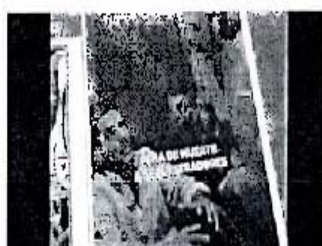
(Fotogramas del spot de tv y novelas)