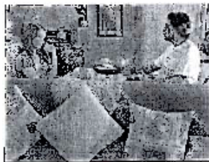
(Fotograma capítulo 216 transmitido el día 22 de junio de 2009)