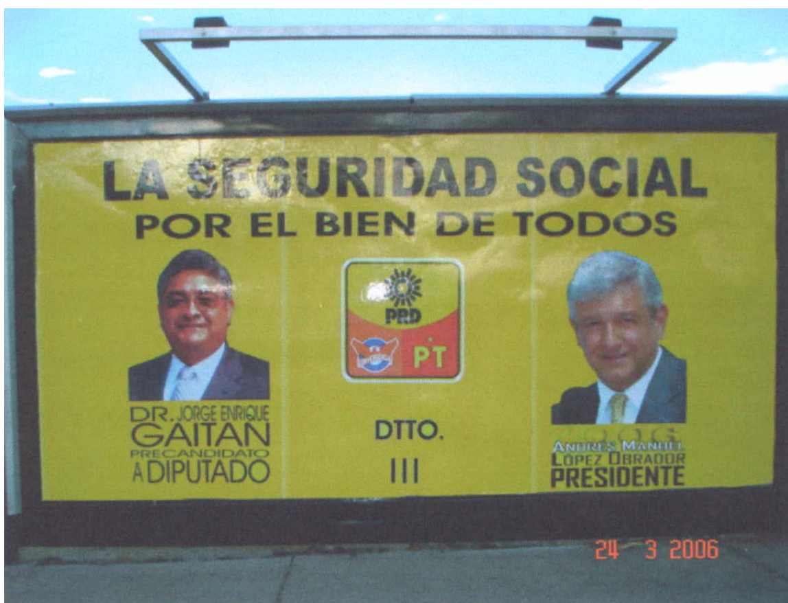
AV. JOSE F. ELIZONDO CASI ESQUINA CON AYUNTAMIENTO

A dicha acta se anexó la fotografía siguiente: