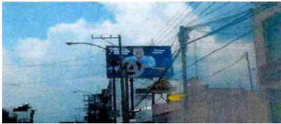
Espectacular Casimiro Liceaga (por PGR)