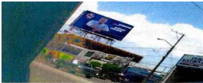
Espectacular Abasolo esq. Av. San Miguelito