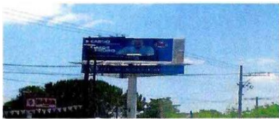
Espectacular en av. Reforma. Paseo Irapuato