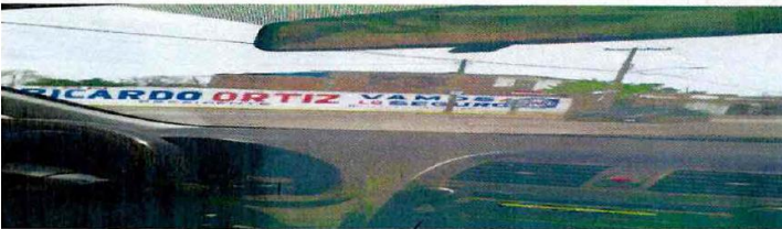
Barda Casimiro liceaga esq. Av Insurgentes