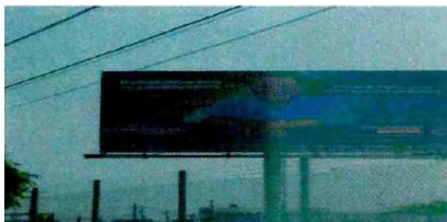
Espectacular carr. Salamanca (complejo pemex)