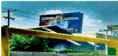
Espectacular blvd. Díaz Ordaz (cerca Banorte)