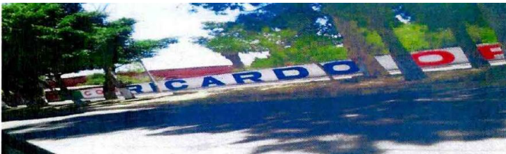
Barda calle francisca Delgado, esq. Casimiro liceaga