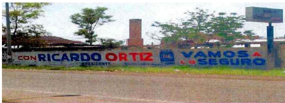
Barda en calzada de los chinados (lienzo charro ILO)