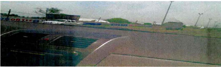
2 Bardas en col. la lagunilla