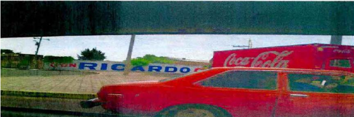
Barda en carr. Irapuato- abasolo