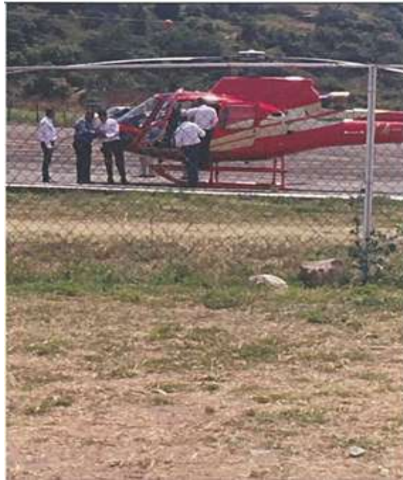
El helicóptero color rojo con matrícula XA-UUK, llevo Inq. Silvano Aureoles Conejo