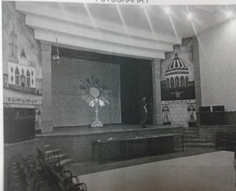
En la fotografía 7 se aprecia la vista del escenario, quedando a sus costados los murales correspondientes a "Nuestra Señora de la Soledad". --