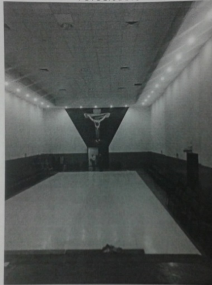
En la fotografía 6, se aprecian las dimensiones del auditorio "San Román Adame"; la toma está realizada desde el escenario, pudiendo verse al fondo la puerta de acceso, así como el mural del hombre crucificado.