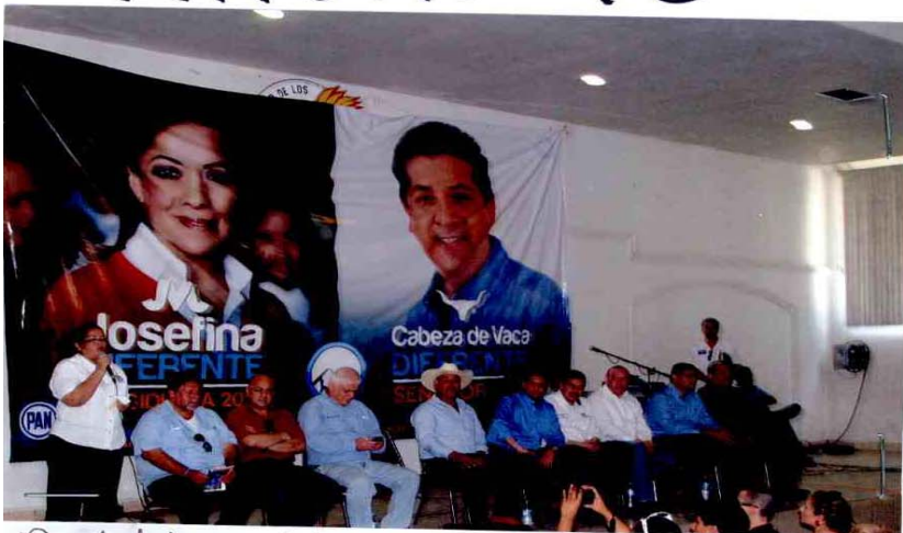
Presidium del evento con el candidato Francisco Javier García Cabeza de Vaca.