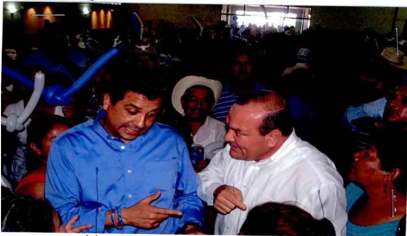
Francisco Javier García Cabeza de Vaca... Candidato a Senador por el P.A.N.