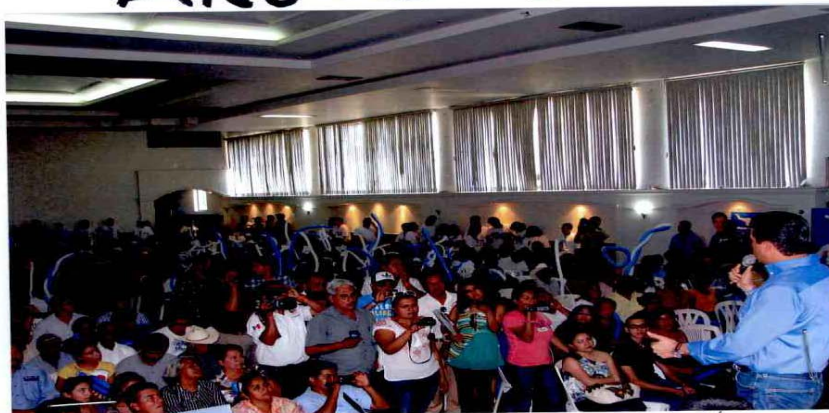
Evento del candidato del P.A.N. Francisco Javier García Cabeza de Vaca en donde el Presidente del P.A.N. los invita a votar por sus candidatos.