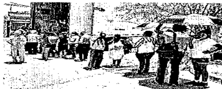
► Mujeres y hombres hicieron fila frente al tráiler localizado en la calle Matamoros, casi con Bulvar Harold R. Pape.

Mujeres y hombres hicieron fila frente al tráiler localizado en la calle Matamoros, casi con Bulvar Harold R. Pape, mientras que el centro de distribución oficial está a dos cuadras de ese lugar.