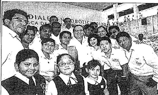
El gobernador de Veracruz, Javier Duarte de Ochoa, felicitó personalmente a los dos equipos de estudiantes de la Universidad Tecnológica de Gutiérrez Zamora que obtuvieron primero y cuarto lugares en el Campeonato Mundial de Colegios 2012 Vex Robotics, en Anaheim, California. El mandatario expresó que "en estos jóvenes activos y propositivos reside nuestra confianza de que el porvenir de Veracruz está en buenas manos".

El gobernador Javier Duarte de Ochoa expresó que en estos jóvenes activos y propositivos "reside nuestra confianza de que el porvenir de Veracruz está en buenas manos. Mujeres y hombres decididos a dejar atrás pasados de rezago y falta de oportunidades, jóvenes cuya fuerza mueve a millones de veracruzanos, inmersos en un proceso de transformación social".