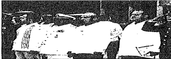
El gobernador Javier Duarte de Ochoa y el presidente Felipe Calderón Fournier encabezaron la ceremonia protocolaria por el Día de la Marina. Los acompañaron autoridades federales, estatales y de la Marina Armada de México.