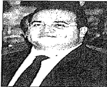
El gobernador Javier Duarte de Ochoa recibió un galardón internacional por la creación de la Universidad Popular Autónoma de Veracruz (UPAV), un modelo único que causó sensación en países de Sudamérica por ser responsable y sustentable. La Intercontinental Union For Quality entregó el reconocimiento y la medalla The Quality Awards 2012.

mio TheQualityAwards 2012 a empresas e instituciones que han destacado en el desarrollo de acciones que son modelos de éxito, por lo que el galardón es un reconocimiento y homenaje a instituciones que con su actividad realizan un importante aporte a las comunidades, estados y países en que efectúan su trabajo.