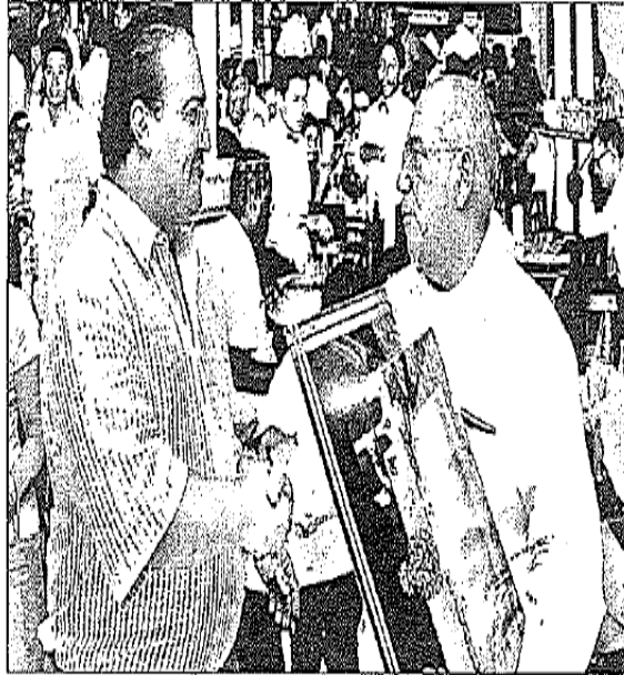
El gobernador Javier Duarte de Ochoa desayunó la mañana de este sábado en el café La Parroquia, de Gómez Farfás, en el Malecón, con el secretario de la Marina, Mariano Francisco Saynez Mendoza. El mandatario reforzó la coordinación que su gobierno mantiene con las fuerzas armadas para garantizar la tranquilidad de los veracruzanos.

Duarte manifestó que "la relación entre el gobierno federal y el del estado es magnífica; hemos mantenido de manera muy coordinada las acciones en diferentes materias y, el día de ayer que tuvimos la posibilidad de celebrar aquí en Veracruz el Día de la Marina, hicimos un reconocimiento muy merecido, un reconocimiento justo por parte de la sociedad veracruzana a estas mujeres y hombres que aportan su vida al servicio de nuestra sociedad".