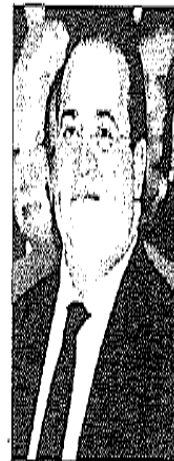
El gobernador de Veracruz, Javier Duarte de Ochoa, recibió un reconocimiento de la Intercontinental Union for Quality por la creación de la UPAV.

En su evaluación, destacó que la labor que la UPAV en 188 municipios de Veracruz ha tenido gran penetración e impacto en sólo año y medio.