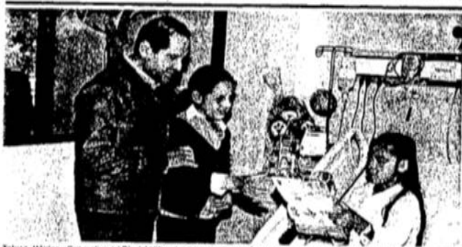
Tehuacan, México.- Con motivo del Día del Niño, el gobernador Enrique Peña Nieto visitó el Hospital para el Niño, para convivir y entregar juguetes a los menores de edad que reciben algún tratamiento clínico, a cuyos padres les dijo que habrá becas para los niños en condiciones de salud difíciles, así como un programa social de apoyo económico para sus familias. •

Los costos de combate por día disminuyeron también la producción de la congeneración, el día 21 costó alrededor de 57 mil pesos porque sólo se movilizó un helicóptero, más operaciones terrestres y agua. El segundo día, cuando el viento reactiva un fuego que pasaba apagado, el costo se multiplica por seis (más de 370 mil pesos) con 200 helicópteros y el tercer día de abril, ya sin duda arriba de 600 mil pesos, pues además de 400 helicópteros, habían entrado en operación dos helicópteros de la Unidad Estatal de Protección Civil. M