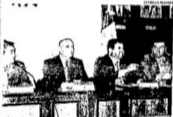
El gobernador de la entidad se reservó la valoración de la obra.

La ruta contará con seis estaciones y los estudios concluirán en noviembre, por lo que su construcción arrancará en 2013