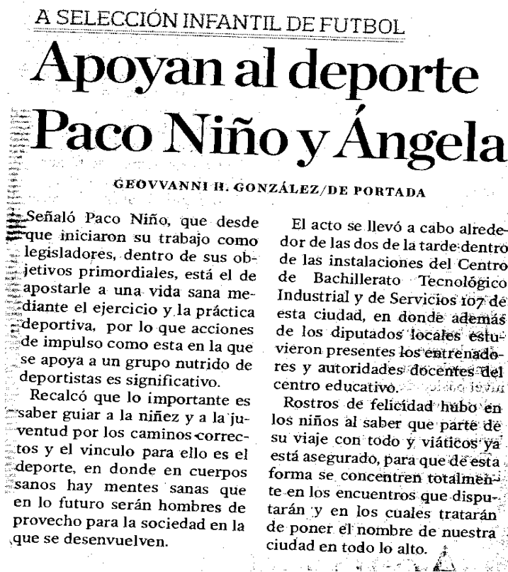
Imagen de la nota periodística de fecha 24 de enero de 2012

Contenido de la nota periodística de fecha 24 de enero de 2012