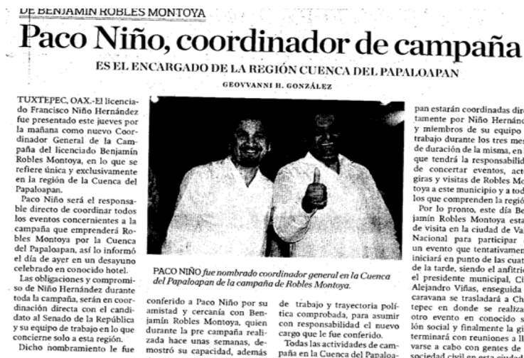
Imagen de la nota periodística de fecha 30 de marzo de 2012