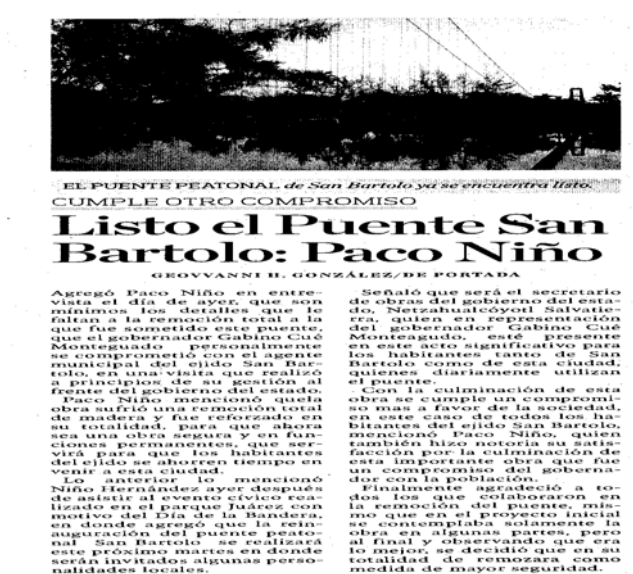
Imagen de la nota periodística de fecha 25 de marzo de 2012

Contenido de la nota periodística de fecha 25 de marzo de 2012