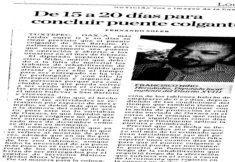
Imagen de la nota periodística de fecha 30 de enero de 2012

Contenido de la nota periodística de fecha 30 de enero de 2012