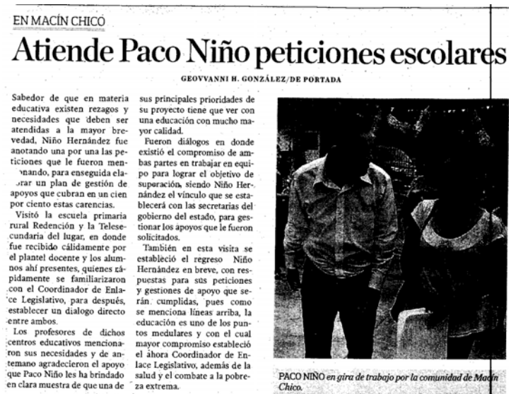
Imagen de la nota periodística de fecha 10 de febrero de 2012

Preciso que a la fecha se llevan invertidos 560 mil pesos, 20 mil más de lo estimado que eran inicialmente 540 mil pesos, por lo que ahora sólo falta esperar unos cuantos días mas para que el puente colgante y peatonal pueda ser nuevamente puesto en funcionamiento luego de la rehabilitación que requirió luego de la afectación que sufriera en el 2010ª causa de la tormenta que registro en la cuenta en dicho año.