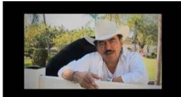
Joan Sebastián: confió en el, por que ha demostrado su capacidad, su entrega.