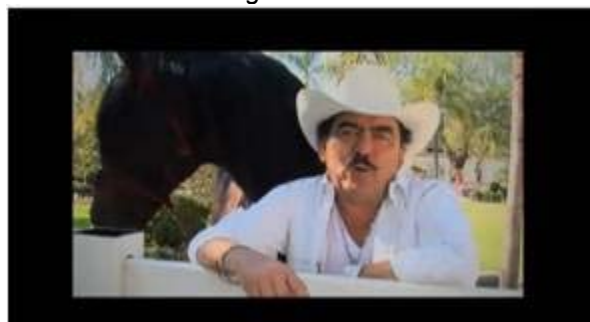
Joan Sebastián: Conoce la problemática de