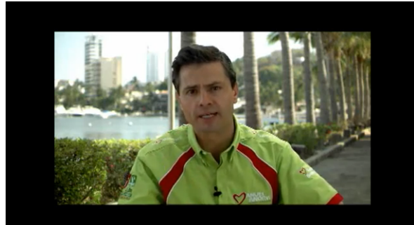
Enrique Peña Nieto: Compromete más empleo para guerrero, más educación para guerrero.