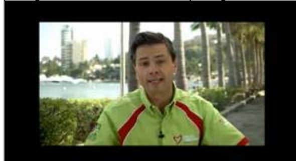
Enrique Peña Nieto: Más salud para guerrero.