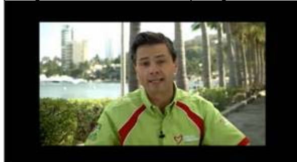
Enrique Peña Nieto: Más salud para guerrero.