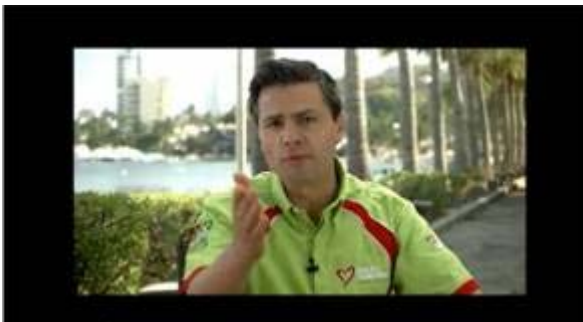
Enrique Peña Nieto: Yo confió en Manuel Añorve porque es una persona que se compromete.