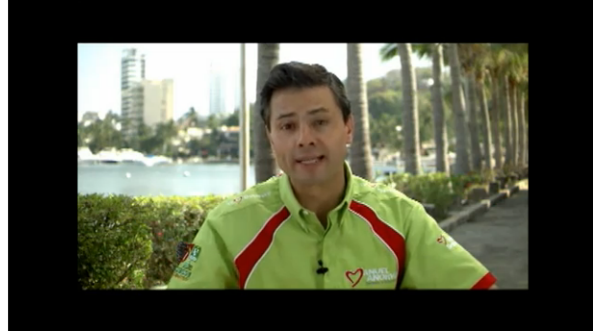
Enrique Peña Nieto: Más salud para guerrero.