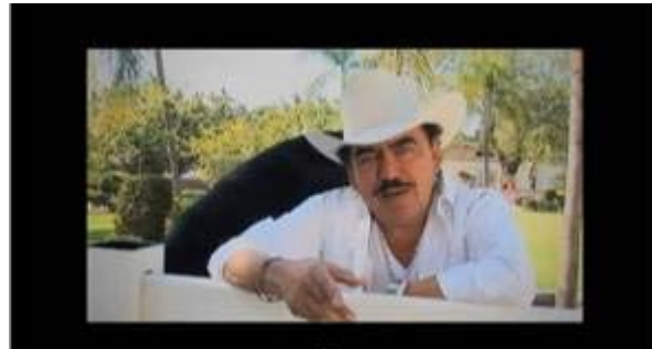
Joan Sebastián: confió en el, por que ha demostrado su capacidad, su entrega.