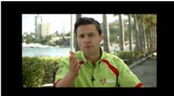
Enrique Peña Nieto: Yo confié en Manuel Añorve porque es una persona que se compromete.