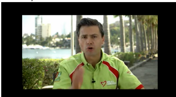
Enrique Peña Nieto: Porque es una gente con experiencia acreditada.