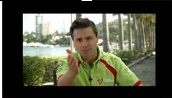
Enrique Peña Nieto: Yo confió en Manuel Añorve porque es una persona que se compromete, confió en Manuel Añorve porque es una gente que promete empleo para guerrero, confió en Manuel Añorve porque conoce a la gente de guerrero, Confío en Manuel Añorve porque traerá mejor y más educación para guerrero, confío en Manuel Añorve porque ama a su Estado.