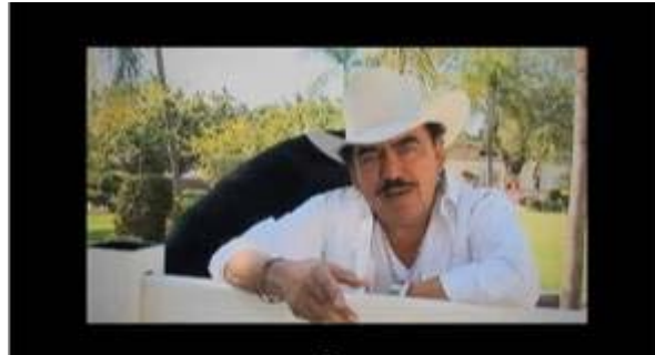
Joan Sebastián: confió en el, por que ha demostrado su capacidad, su entrega.