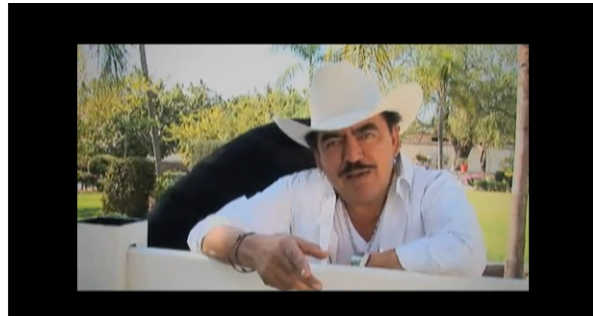
Joan Sebastián: confió en el, por que ha demostrado su capacidad, su entrega.