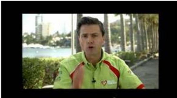
Enrique Peña Nieto: Porque es una gente con experiencia acreditada.