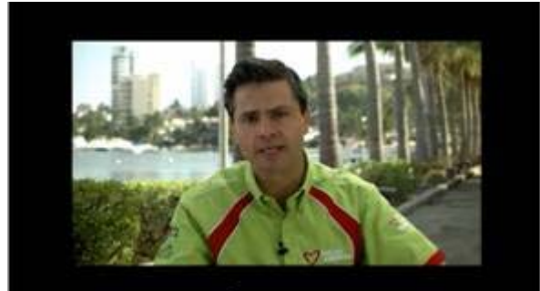
Enrique Peña Nieto: Compromete más empleo para guerrero, más educación para guerrero.