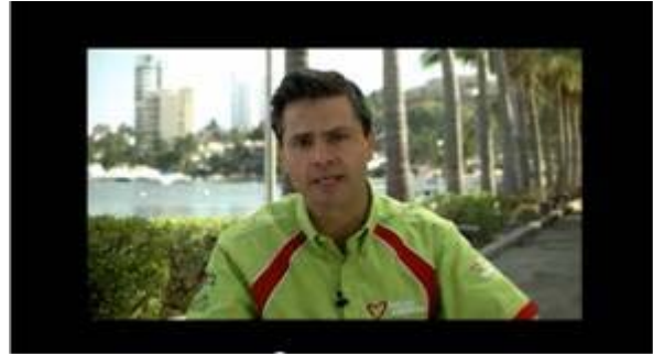
Enrique Peña Nieto: Compromete más empleo para guerrero, más educación para guerrero.