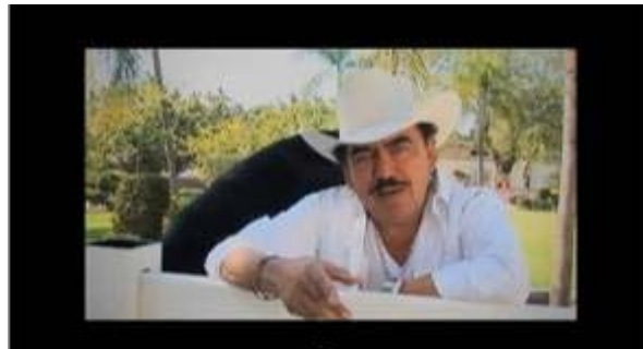
Joan Sebastián: confió en el, por que ha demostrado su capacidad, su entrega.