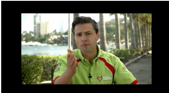
Enrique Peña Nieto: Yo confió en Manuel Añorve porque es una persona que se compromete.