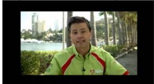
Enrique Peña Nieto: Más salud para guerrero.