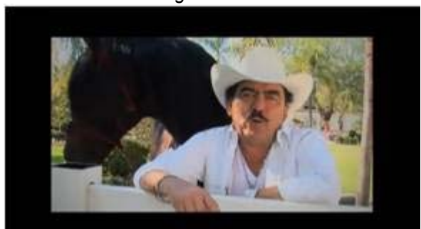
Joan Sebastián: Conoce la problemática de nuestro estado