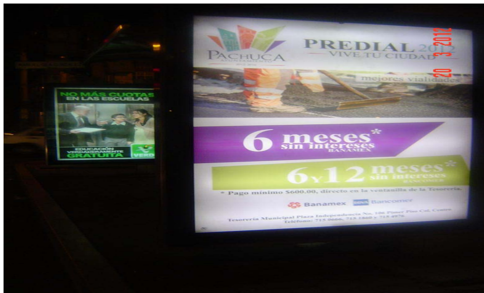
Pánel publicitario ubicado sobre Av. Francisco I. Madero, frente al parque Luis Pasteur (Vista 1)