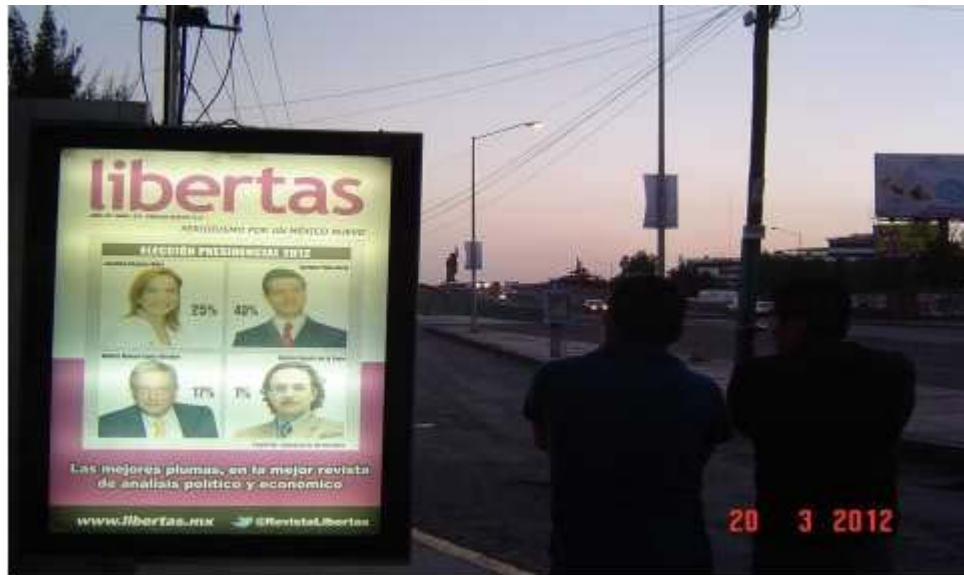
Pánel publicitario ubicado sobre Blvd. Felipe Ángeles, en parada de "La Normal", con dirección Pachuca Centro.