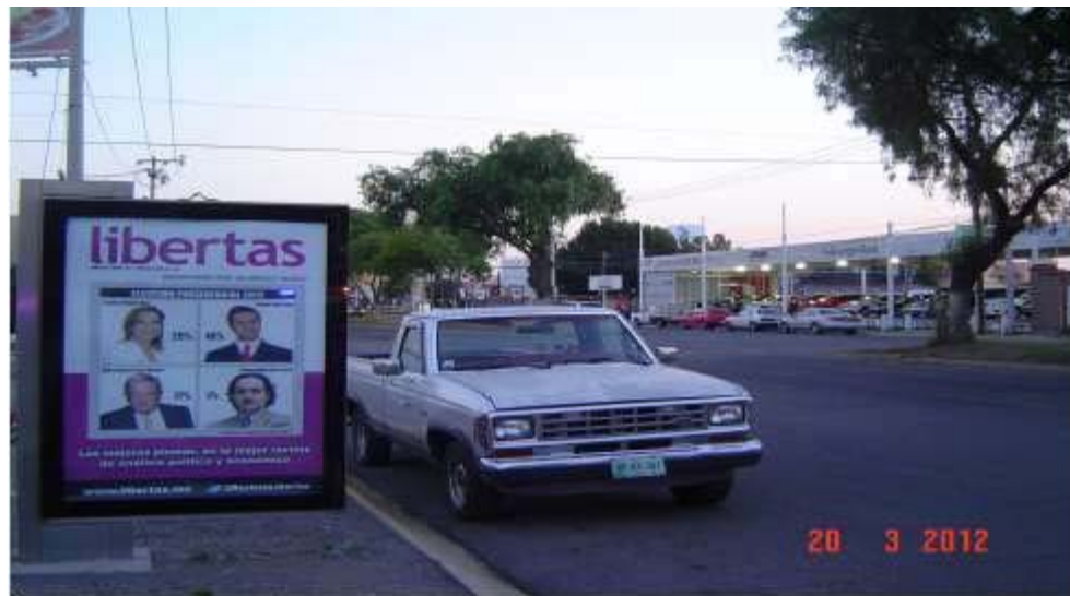
Pánel publicitario ubicado sobre Blvd. Valle de San Javier frente al monumento a Forjadores de Pachuca.