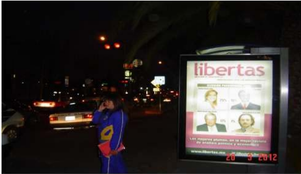
Pánel publicitario ubicado sobre Blvd. Everardo Márquez, frente al hotel La Joya.