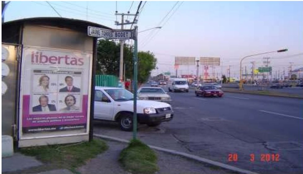
Pánel publicitario sobre Blvd. Luis Donaldo Colosio, frente a Unidad Médica Familiar No. 32 del IMSS