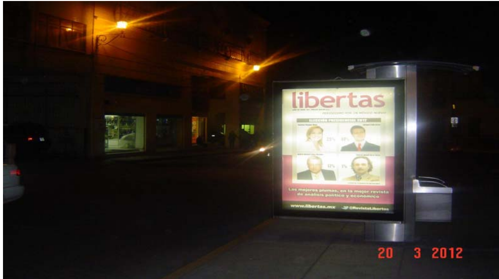
Pánel publicitario ubicado sobre calle Ignacio Allende, frente al parque Niños Héroes