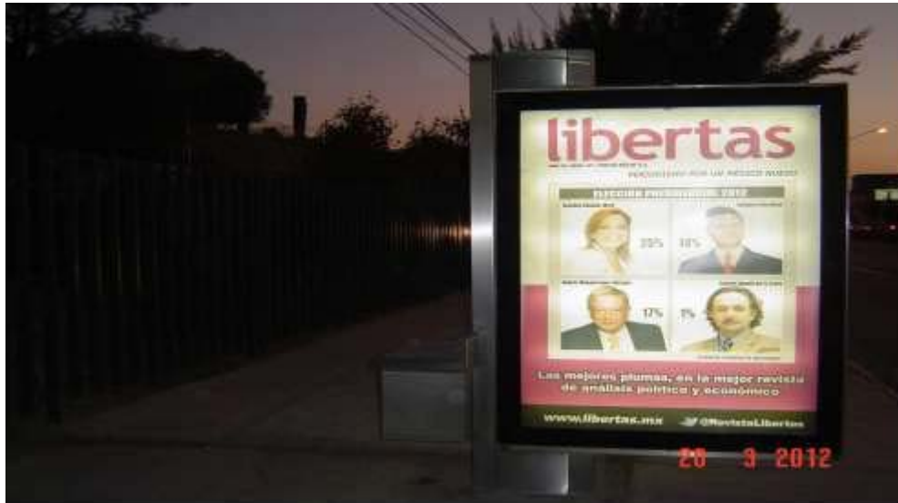
Pánel publicitario ubicado sobre Blvd. Felipe Ángeles frente a la Secretaría del Trabajo y Previsión Social