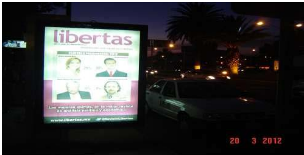
Pánel publicitario ubicado sobre Av. Revolución, frente a plaza comercial Plaza Bella