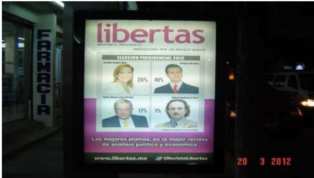
Pánel publicitario ubicado sobre Av. Revolución frente al Club de Leones de Pachuca