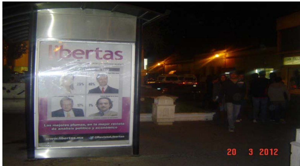
Pánel publicitario ubicado en un puesto de periódicos y revistas de la Plaza Independencia, a un costado del Reloj Monumental