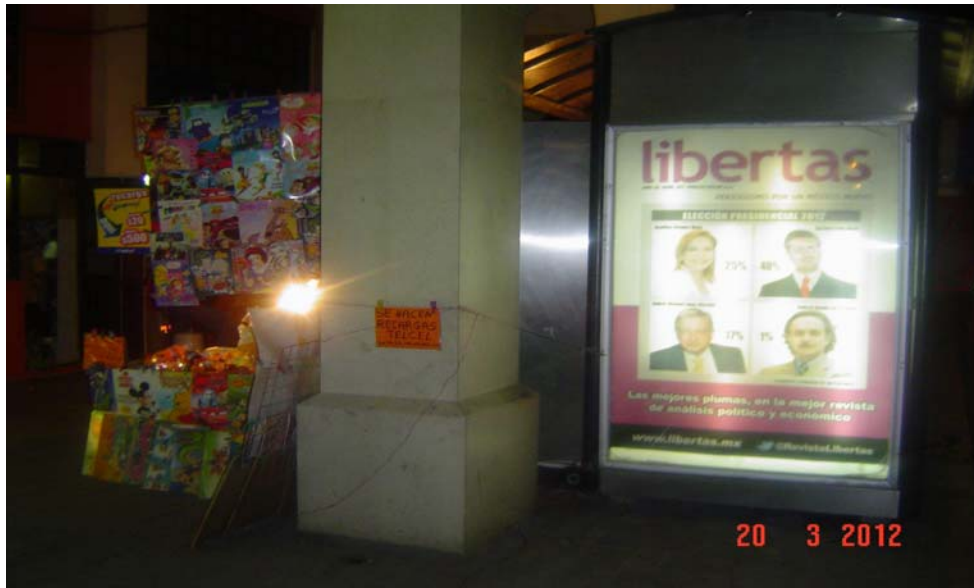
Pánel publicitario ubicado frente a la Plaza Juárez