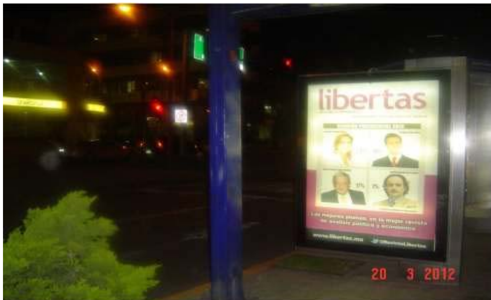
Pánel publicitario ubicado sobre Av. Revolución, frente a la tienda NEXTEL y UNEFON.