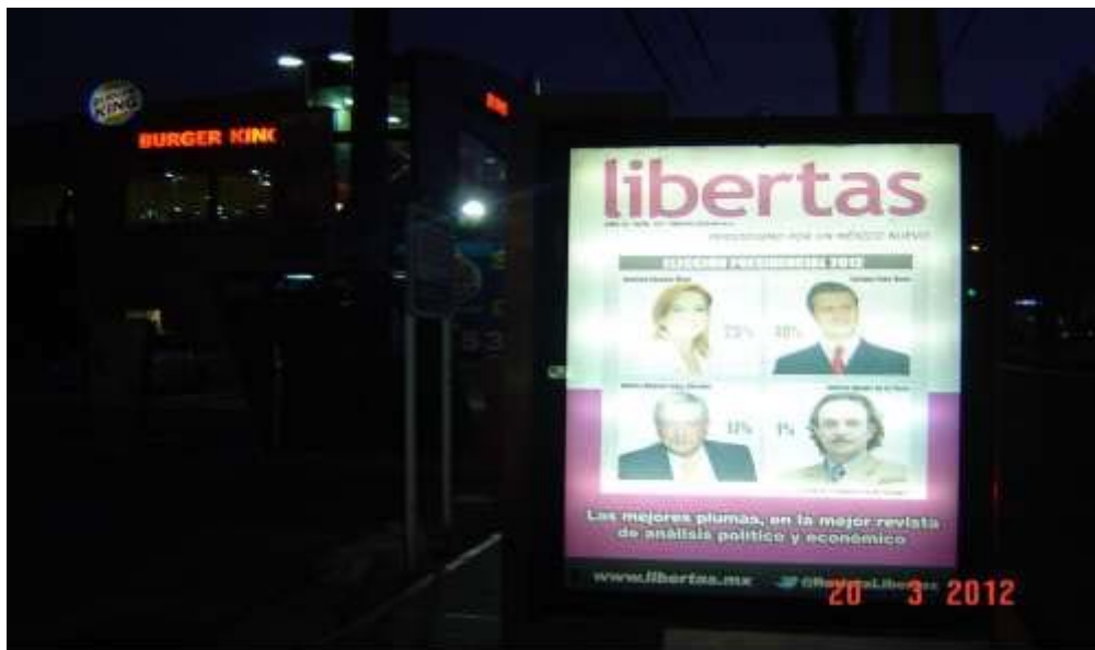
Pánel publicitario ubicado sobre Blvd. Everardo Márquez, frente al restaurant Chillis