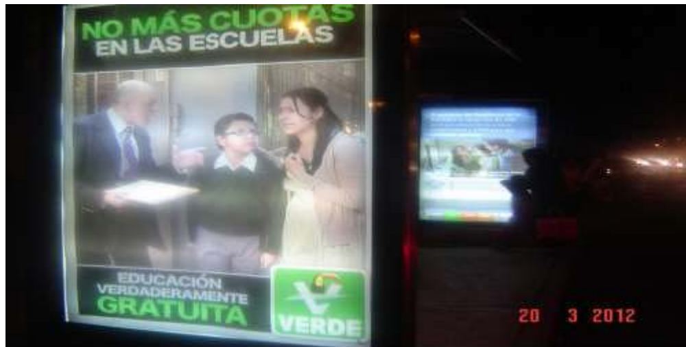
Pánel publicitario ubicado sobre Av. Revolución, frente al Monumento al Maestro (Vista 1)