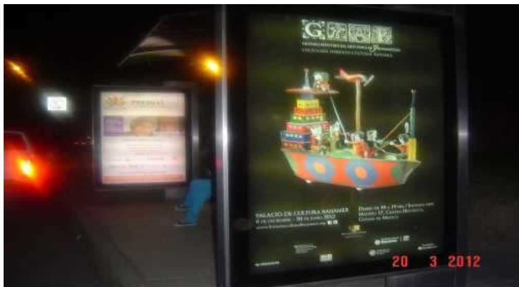
Pánel publicitario ubicado sobre Av. Revolución frente al Monumento al Maestro (Vista 2)