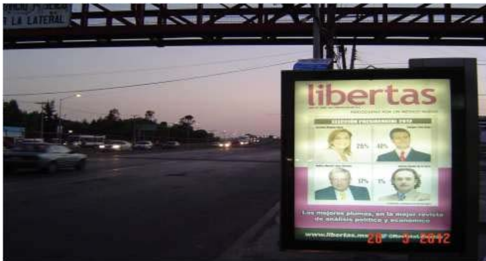
Pánel publicitario ubicado sobre Blvd. Felipe Ángeles en la parada de "La Normal", con dirección salida al Distrito Federal.