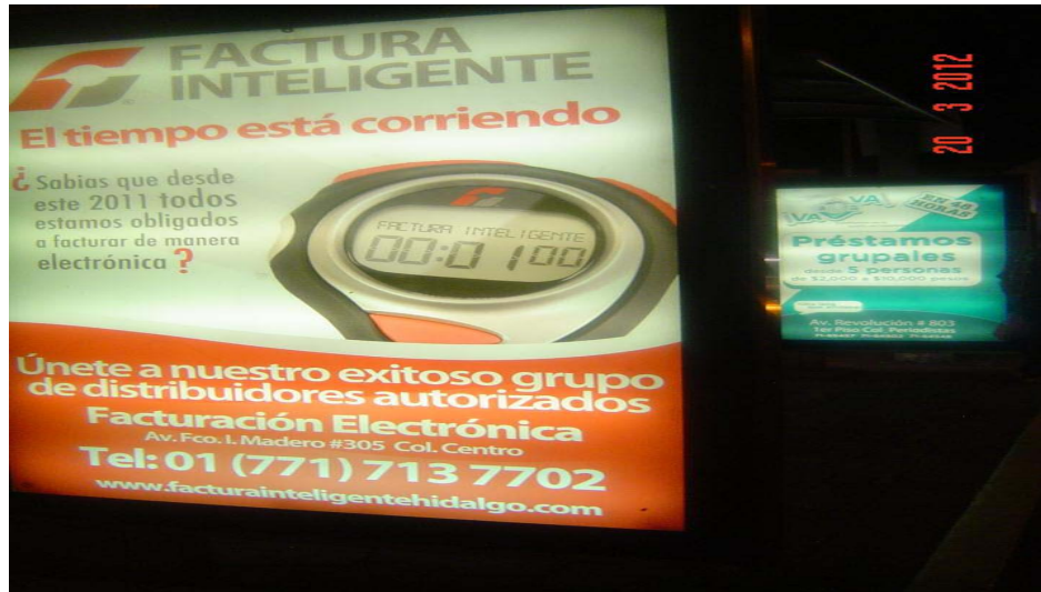
Pánel publicitario ubicado sobre Av. Francisco I. Madero, frente al parque Luis Pasteur (Vista 2)