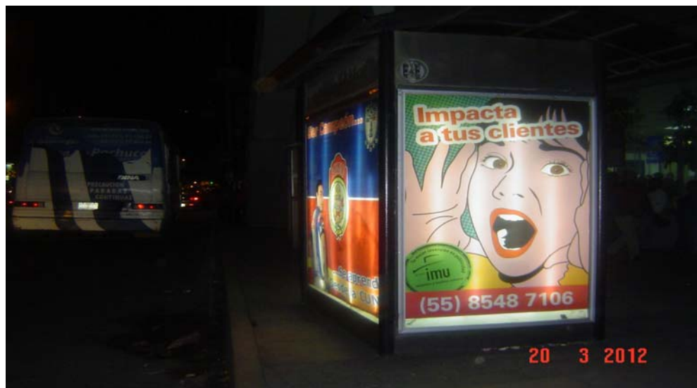
Pánel publicitario ubicado sobre Av. Franciso I. Madero, frente a la escuela primaria general Centro Escolar Hidalgo