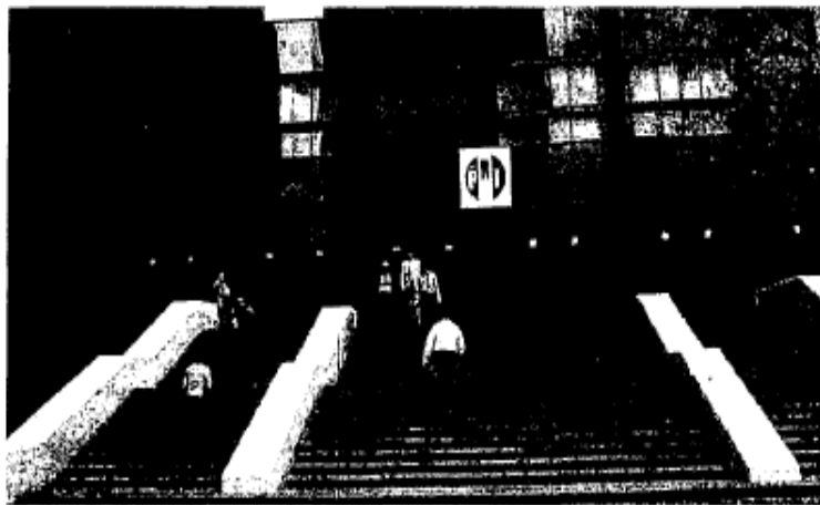
La reunión de gobernadores, coordinadores parlamentarios, candidatos, líderes campesinos y obreros fue en el CEN.