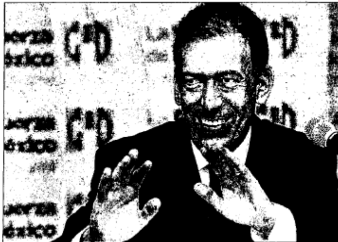
Humberto Moreira, líder del PRI (en la imagen), se reunió con gobernadores, legisladores y dirigentes de organizaciones del tricolor para concretar una estrategia que les permita "aplantar al PAN en 2012", según palabras del aspirante a la gubernatura de Coahuila Rubén Moreira

nimo parque, ante las protestas desatadas, sobre todo en Twitter, ¡hasta mañana, con Jesús Zambrano tratando de responsabilizar desde ahora al lopezobradorismo y al propio Encinas por la eventual derrota que sufriera el PRD por no acomodarse a la alianza con el PAN!