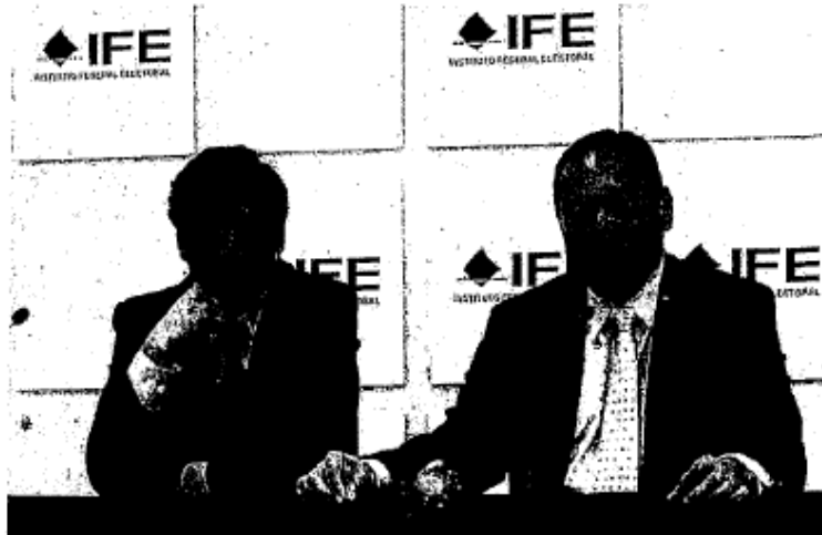
El nuevo presidente del PRD, Jesús Zambrano, de visita al IFE, reiteró el llamado para militantes de respetar la consulta para una eventual alianza con el PAN.

Se declaró preparada para el segundo debate que se realizará el 11 de abril, "si me dicen que es hoy en la tarde, estoy lista", afirmó.