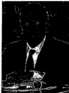
Cónclave electoral. Los principales líderes priistas se reunieron para revisar...