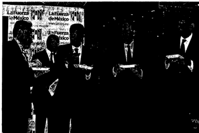
JDE LENGUAY Los estrategas en el Edomex y su virtual candidato a la Gobernatura se reunieron con el líder nacional, Humberto Moreira, y pusieron el codo a 90 grados para agarrar el taco.