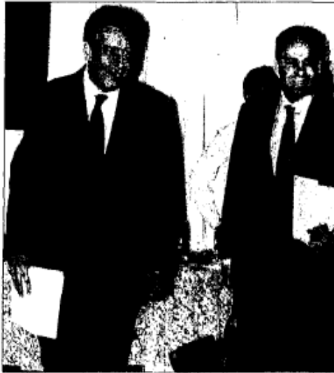
CONFERENCIA. El líder nacional priista, Humberto Moreira, y Eruviel Ávila.

Moreira utilizó esta vez su conferencia de prensa de los lunes por la mañana no para presentar un diagnóstico sobre alguno de los graves problemas que enfrenta la nación, sino para dar un espaldarazo a Eruviel Ávila, en la víspera de que se convierta, el próximo jueves, en candidato oficial del tricolor.