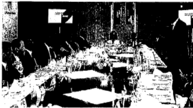
Humberto Moreira ante gobernadores, líderes de los sectores y coordinadores parlamentarios de su partido.