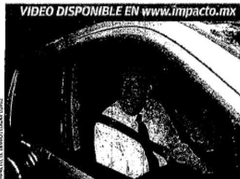
Rubén Moreira aseguró que toda la conversación giró en torno a la estrategia prístia para el año 2012.