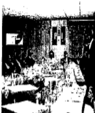
LA REUNIÓN prlista se realizó en la sede nacional del partido.