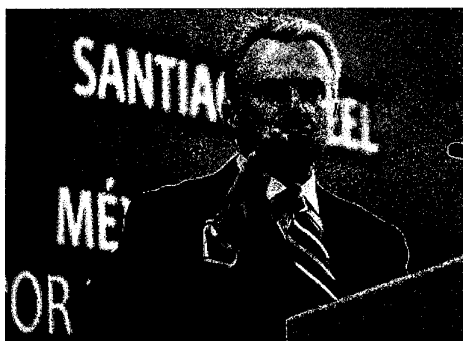
El senador con licencia y aspirante presidencial del Partido Acción Nacional (PAN), Santiago Creel.