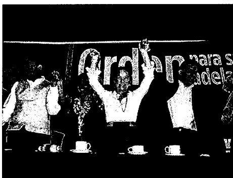
Josefina Vázquez Mota (centro), quien encabeza las encuestas en Acción Nacional, durante su visita por Michoacán.