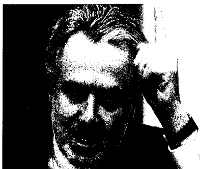
Santiago Creel Miranda afirma que se siente con la suficiente fuerza de las ideas para dar la lucha en el PAN por la candidatura.

• El legislador dice que ejercerá sus derechos en el PAN