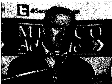
Ante la posibilidad de declinar a la candidatura presidencial, señaló que él va muy bien en las encuestas.

• Coahuila tendría que pagar 34 mil millones de pesos para subsanar la deuda dejada por Moreira