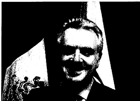
A través de un video en Internet, el aspirante panista reacciona al anuncio hecho por Emilio González.

• La decisión es favorable para la unidad del PAN rumbo a 2012, asegura el político