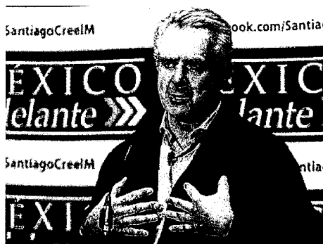
El precandidato presidencial Santiago Creel dijo que de ser el mandatario no bajará la guardia contra el crimen organizado.

◦ El grupo deberá estar dedicado 20% al trabajo policial y 80% a la investigación