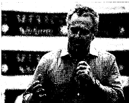
El aspirante a la candidatura presidencial del PAN, Santiago Creel.

• Señala que desea recuperar el voto libre de la militancia