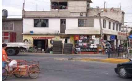
Av. Ferrocarril Sur