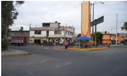
Av. Ferrocarril Sur

Se muestra una serie de testimonios fotográficos del domicilio señalado: