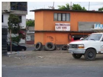
Av. Ferrocarril sur