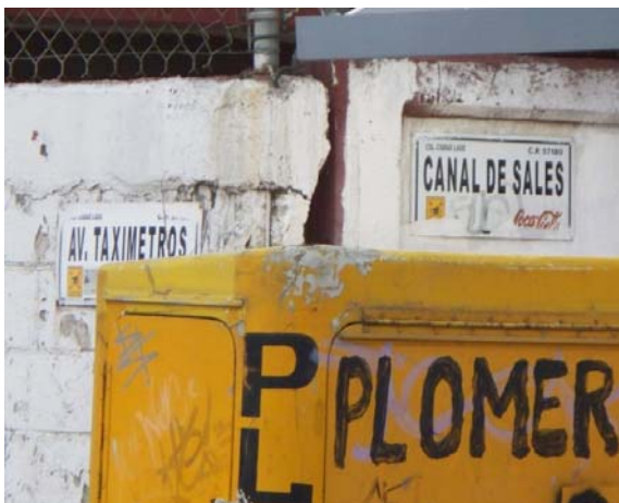
Av. Canal de Sales