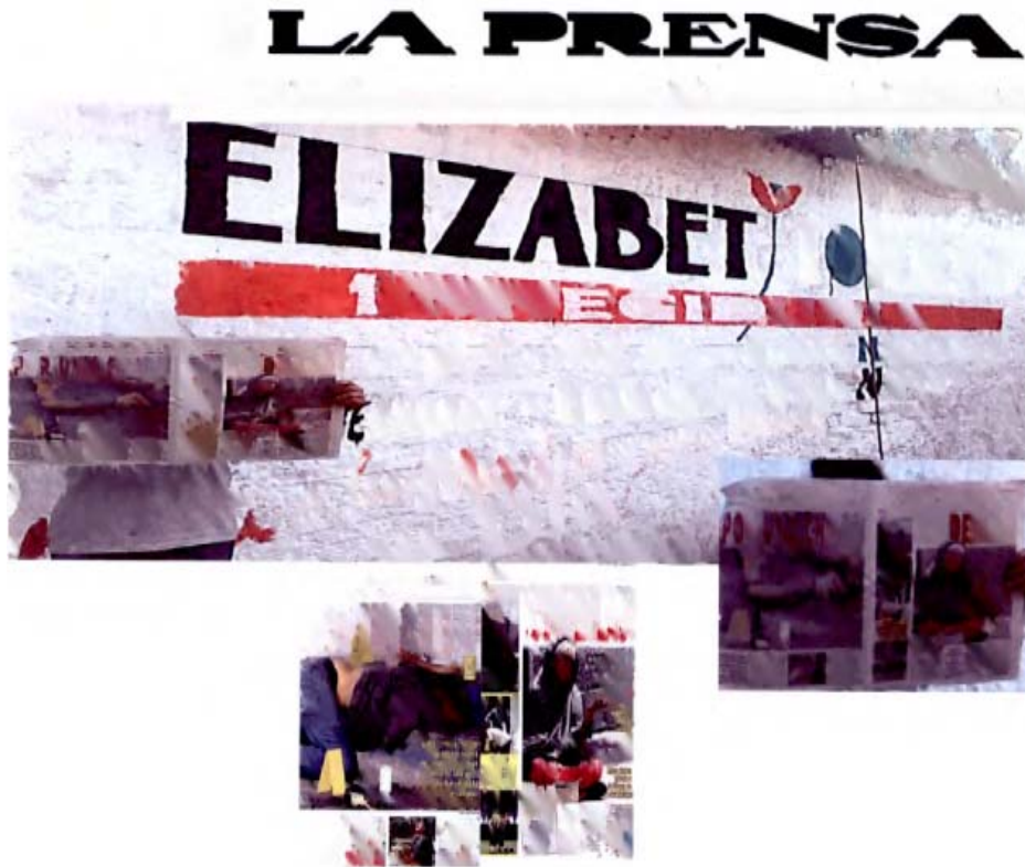
Portadas del periódico "LA PRENSA" del día 10 de mayo de 2010