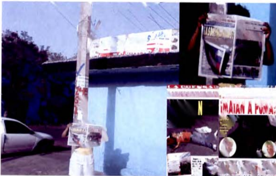
Portadas del periódico "La Prensa" del día 08/05/2010