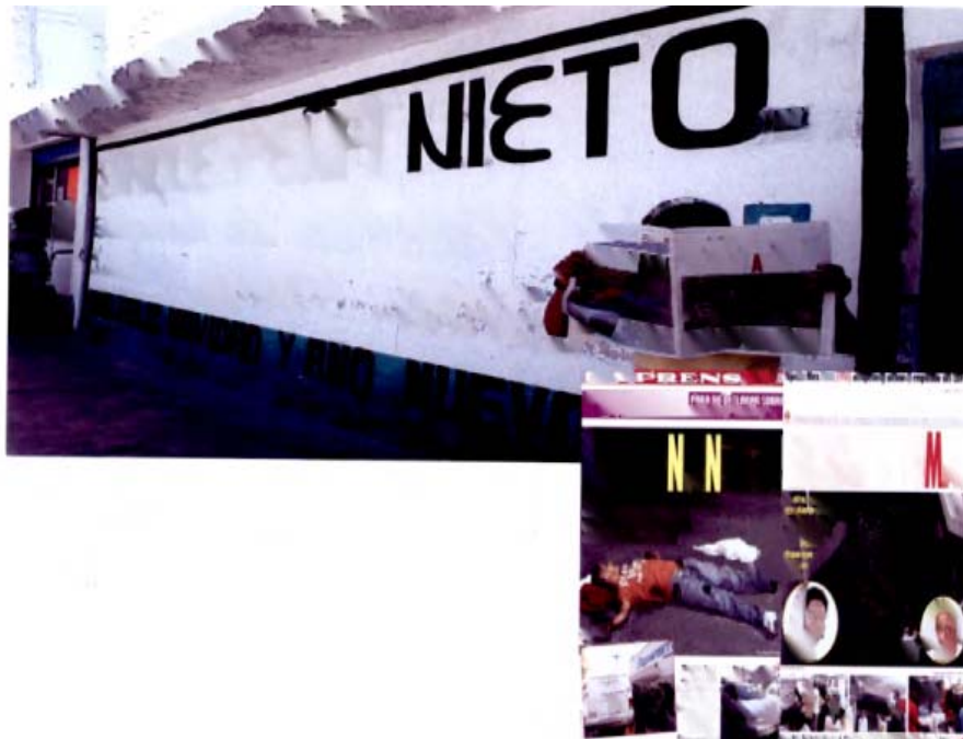
Portadas del periódico "La Prensa" del día 0810512010