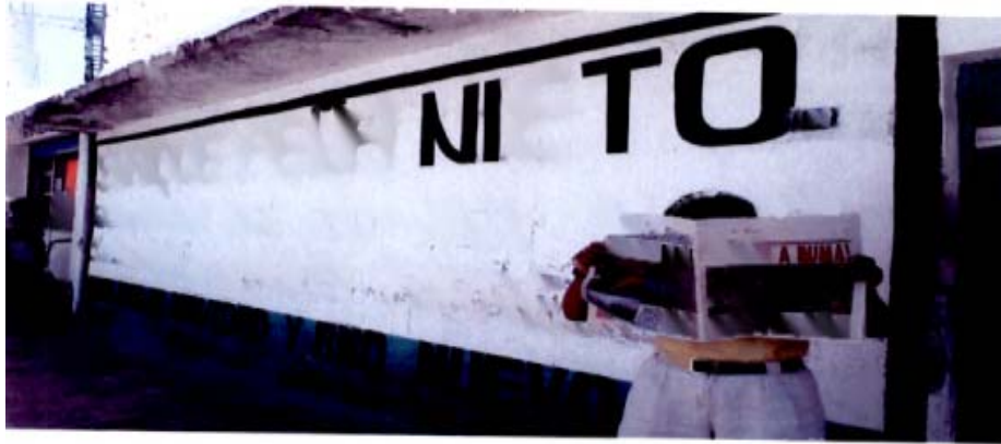
Portadas del periódico "La Prensa" del día 0810512010