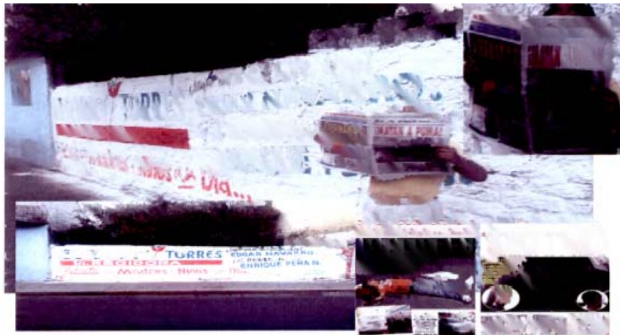
Portadas del periódico "La Prensa" del día 08/05/2010