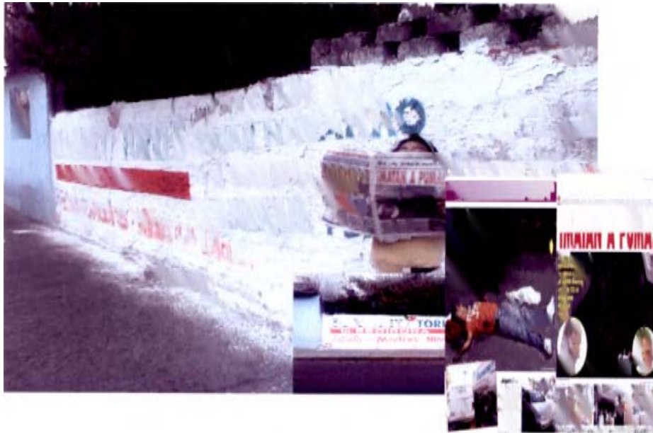
Portadas del periódico "La Prensa" del día 08/10/2010