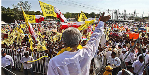
LA TAREA. De gira por la región de Costa Chica, López Obrador pidió a sus simpatizantes guerrerenses cuidar las casillas y asegurar el mayor número de votos el 1 de julio.

"Si ya escuchaste toda la grabación, habrás oído que de las tres horas que dura, el te-