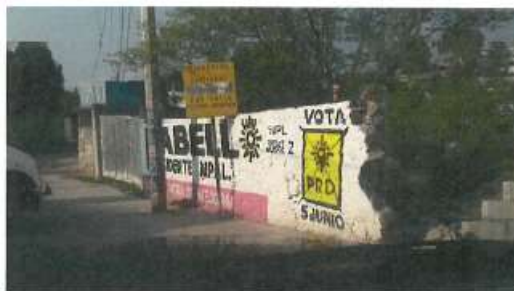
Bardas del Candidato del Partido de la Revolución Democrática, en el Municipio de Jacala de Ledezma, ubicadas en la cancha de futbol en la calle Víctor Monter.

Antes de proceder al análisis de cada una de las bardas, es importante mencionar que en su escrito de queja, el quejoso añade el siguiente texto del lado lateral derecho de la segunda fotografía: “Bardas del Candidato del Partido de la Revolución Democrática, en el Municipio de Jacala de Ledezma, ubicadas en la cancha de futbol en la calle Víctor Monter, tal como se muestra en la captura de pantalla siguiente: