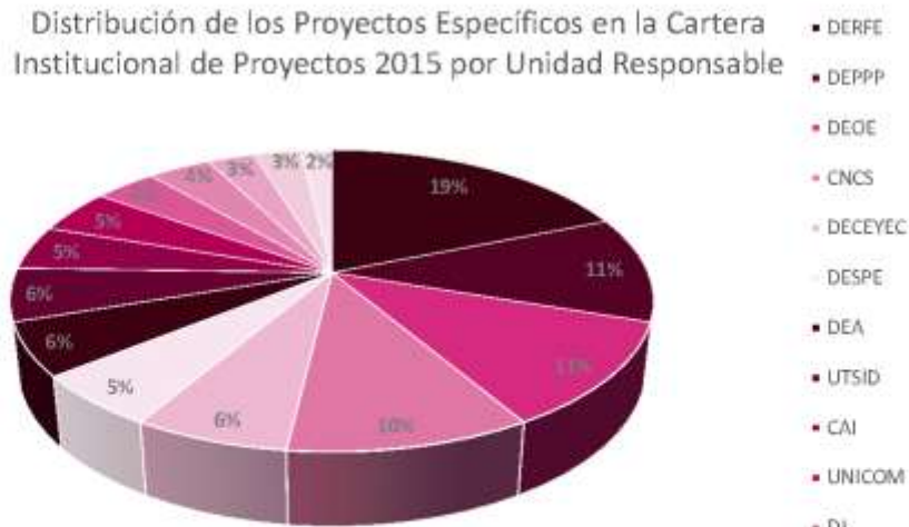
Distribución de los Proyectos Específicos en la Cartera Institucional de Proyectos 2015 por Unidad Responsable