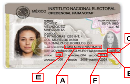
ANVERSO DE LA CREDENCIAL