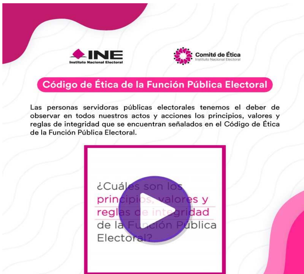
Cuadro 1. Infografías enviadas a las personas servidoras públicas.

Lo anterior, en cumplimiento a la programación de actividades que fue aprobada por el Grupo de Trabajo para este año.