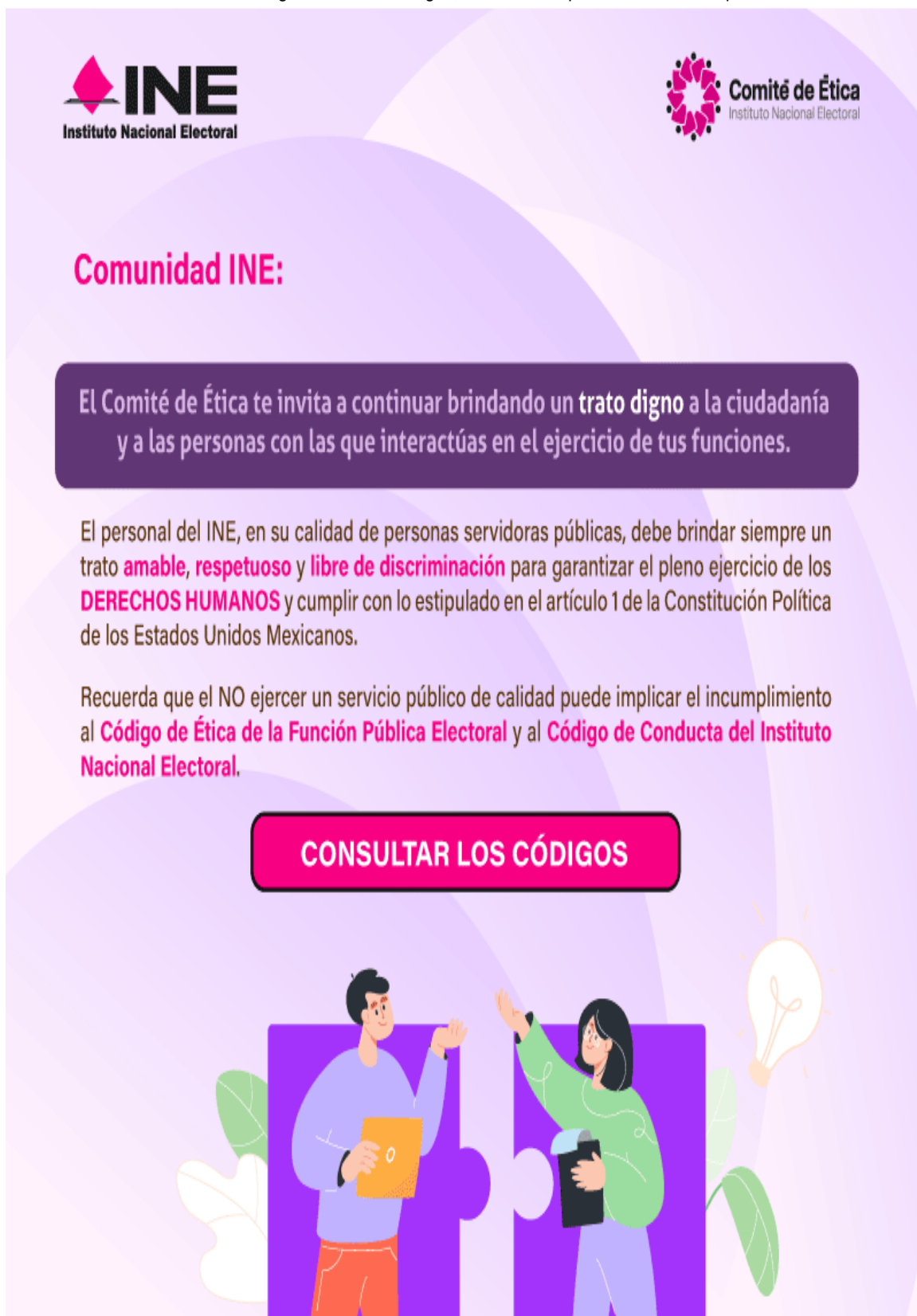
Cuadro 2. Infografía sobre trato digno, enviada a las personas servidoras públicas.