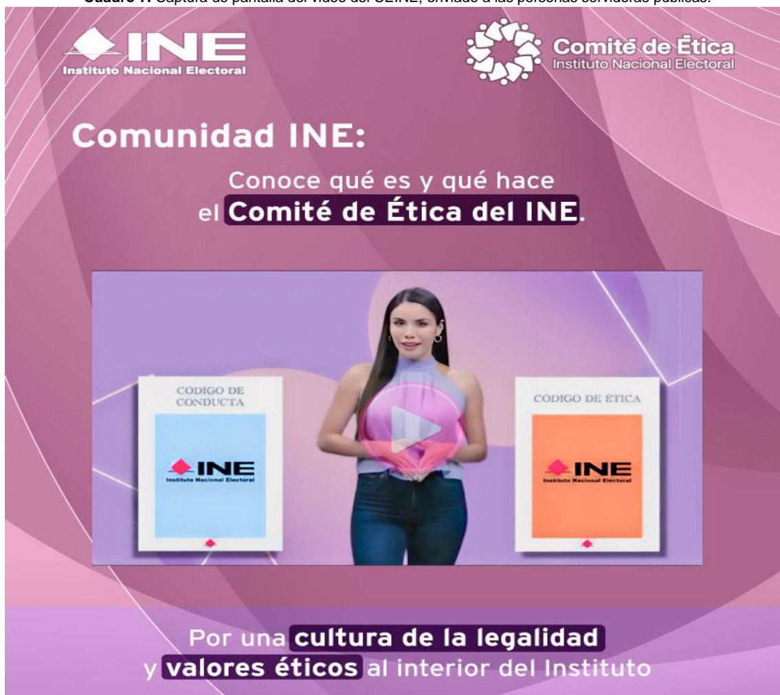
Cuadro 7. Captura de pantalla del video del CEINE, enviado a las personas servidoras públicas.