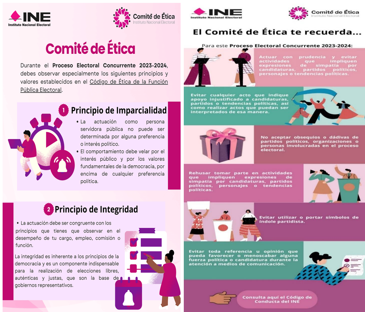
Cuadro 4. Captura de pantalla de las Infografías sobre los principios que abonan al PEF 2023-2024.

Fuente: Consulta en el correo electrónico remitido por la CTG al personal del OIC