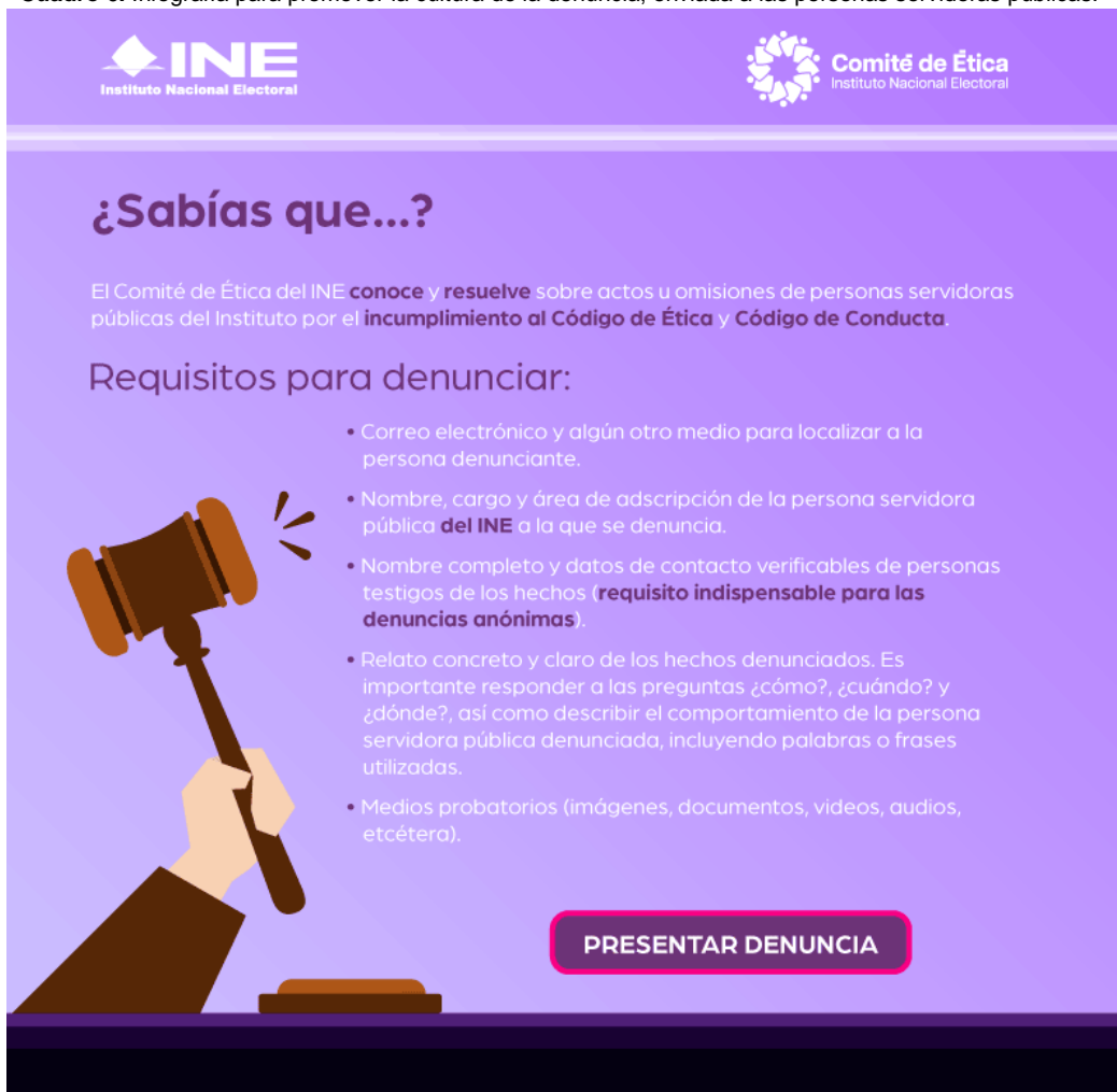
Cuadro 6. Infografía para promover la cultura de la denuncia, enviada a las personas servidoras públicas.