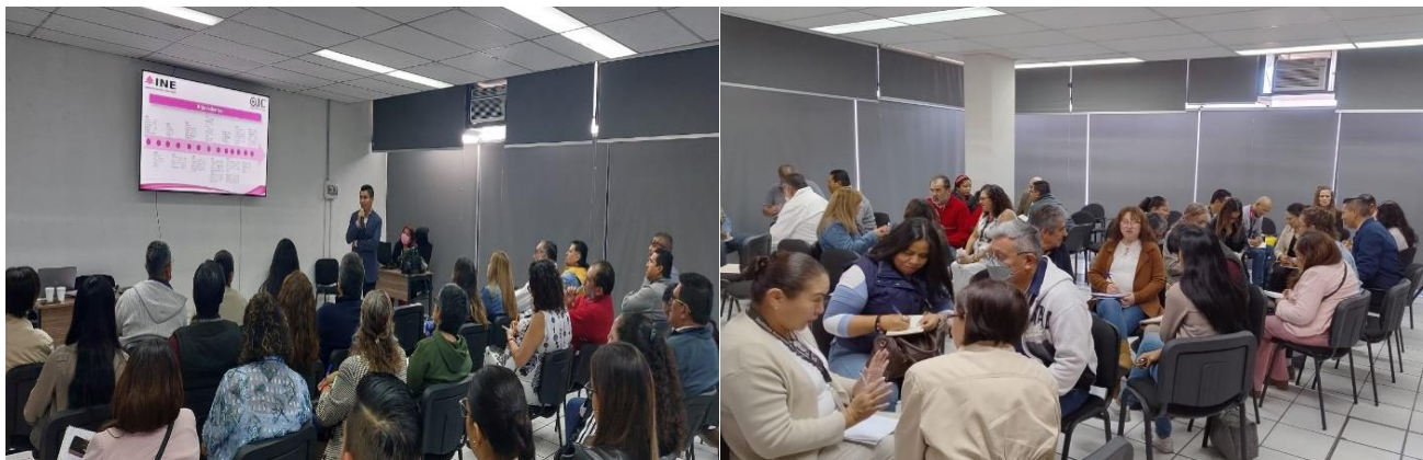
Cuadro 5. Fotografías de las capacitaciones llevadas a cabo en el Estado de Aguascalientes.