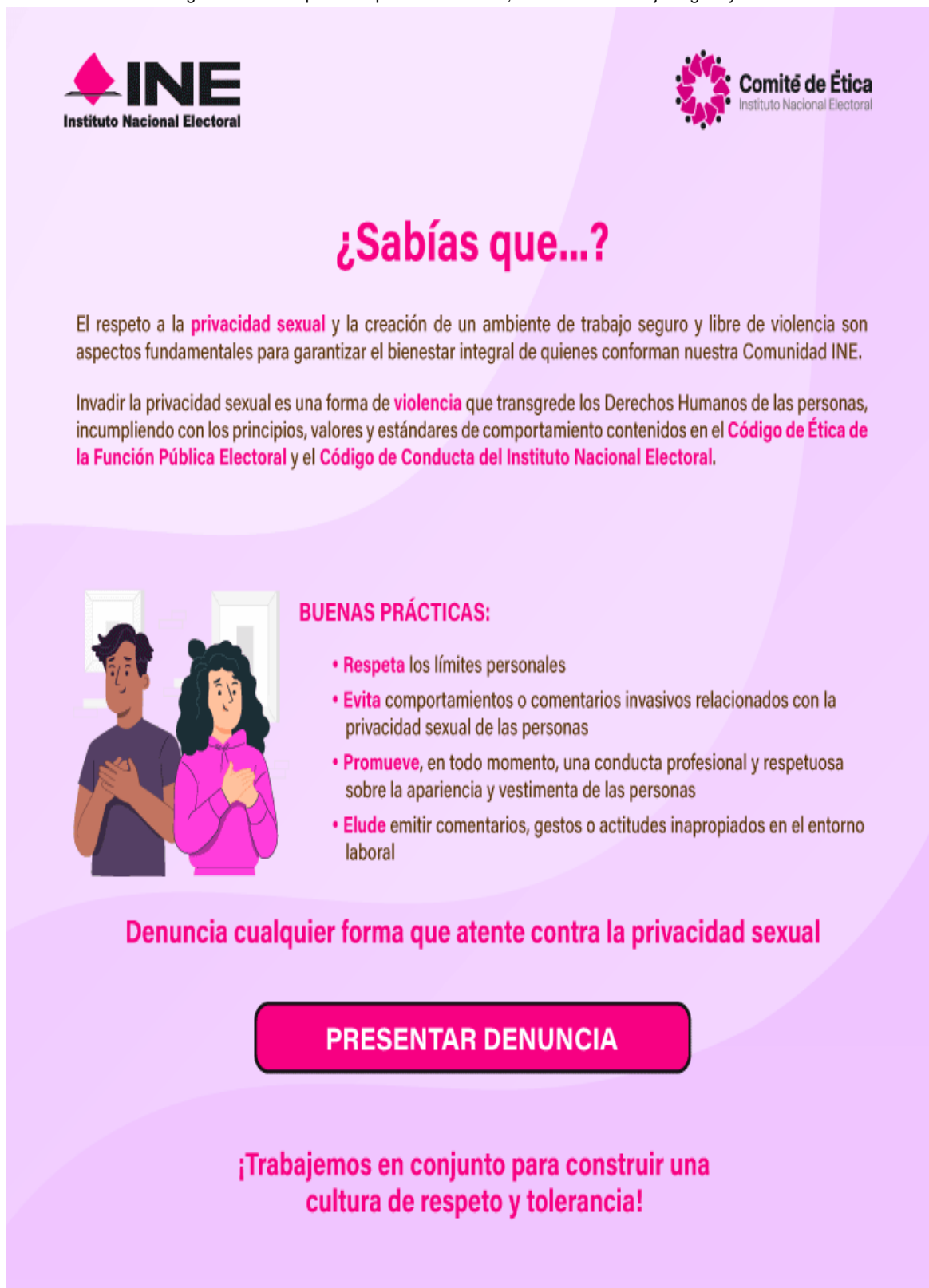
Cuadro 3. Infografía sobre respeto a la privacidad sexual, ambiente de trabajo seguro y libre de violencia.