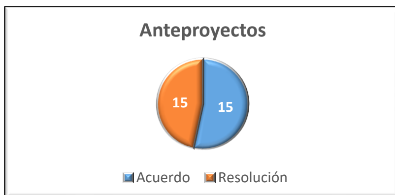
Gráfica 1. Instrumentos aprobados 3

En las sesiones reportadas, se aprobaron un total de treinta Anteproyectos de Acuerdos y de Resoluciones del Consejo General, veintiocho de la CPPP y dos de las Comisiones Unidas (Anexo 2) , además, se presentaron un total de doce Informes (anexo 3) , nueve de la CPPP y tres de las Comisiones Unidas conforme al siguiente cuadro: