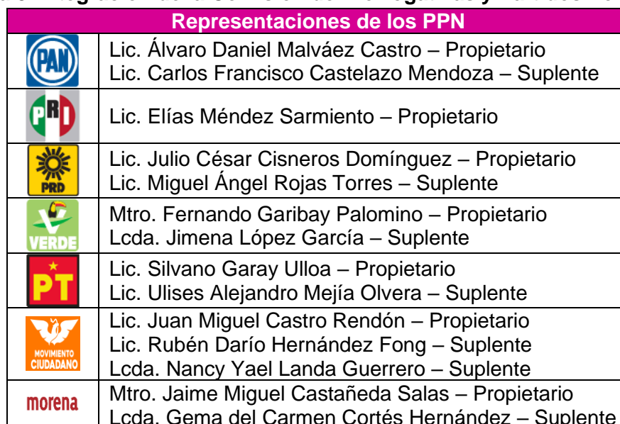
Tabla 3. Integración de la Comisión de Prerrogativas y Partidos Políticos,

En cuanto a las representaciones de los PPN y las representaciones de las Consejerías del Poder Legislativo, estuvieron integradas por las siguientes personas: