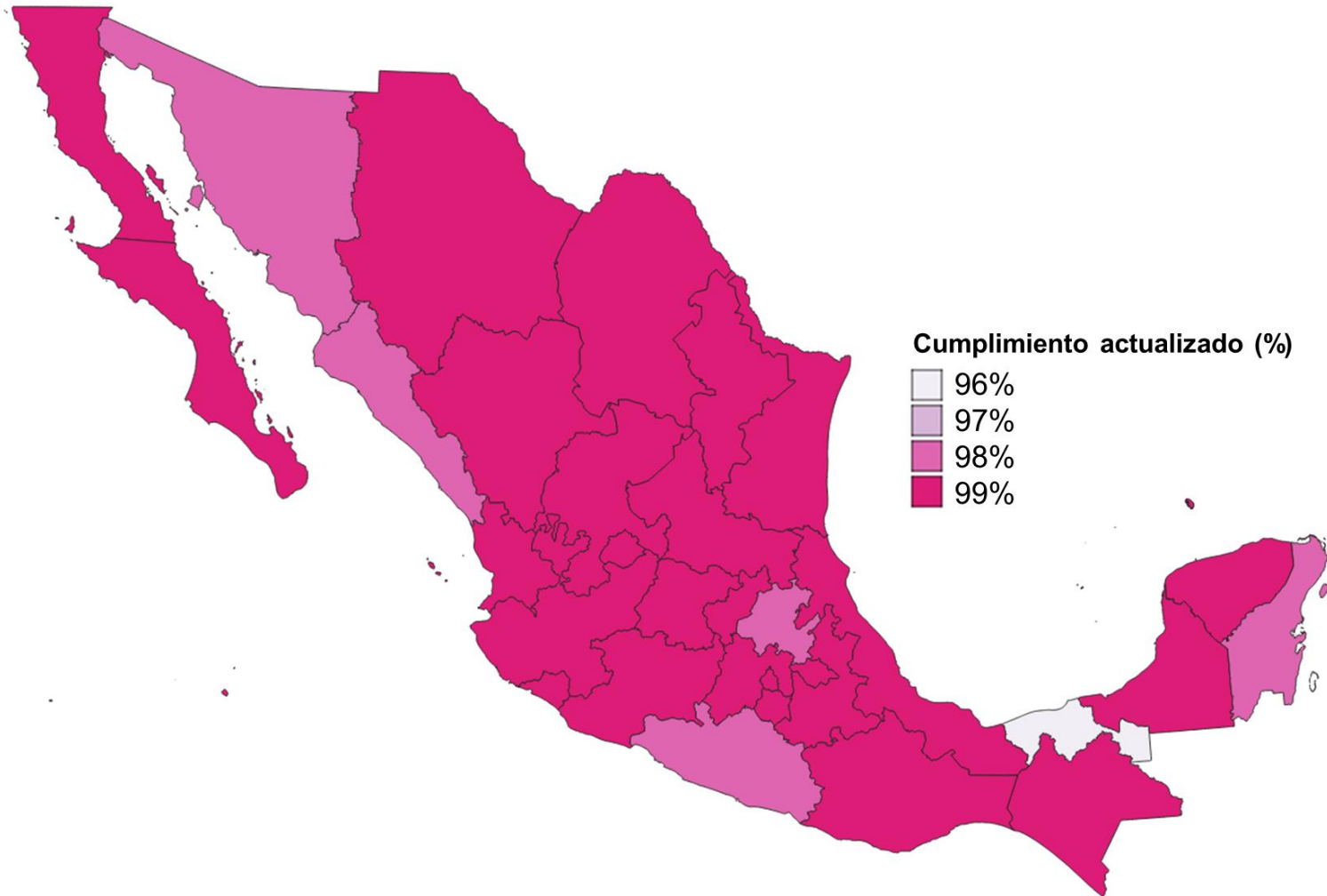
Mapa 1. Cumplimiento actualizado por entidad (periodo ordinario)