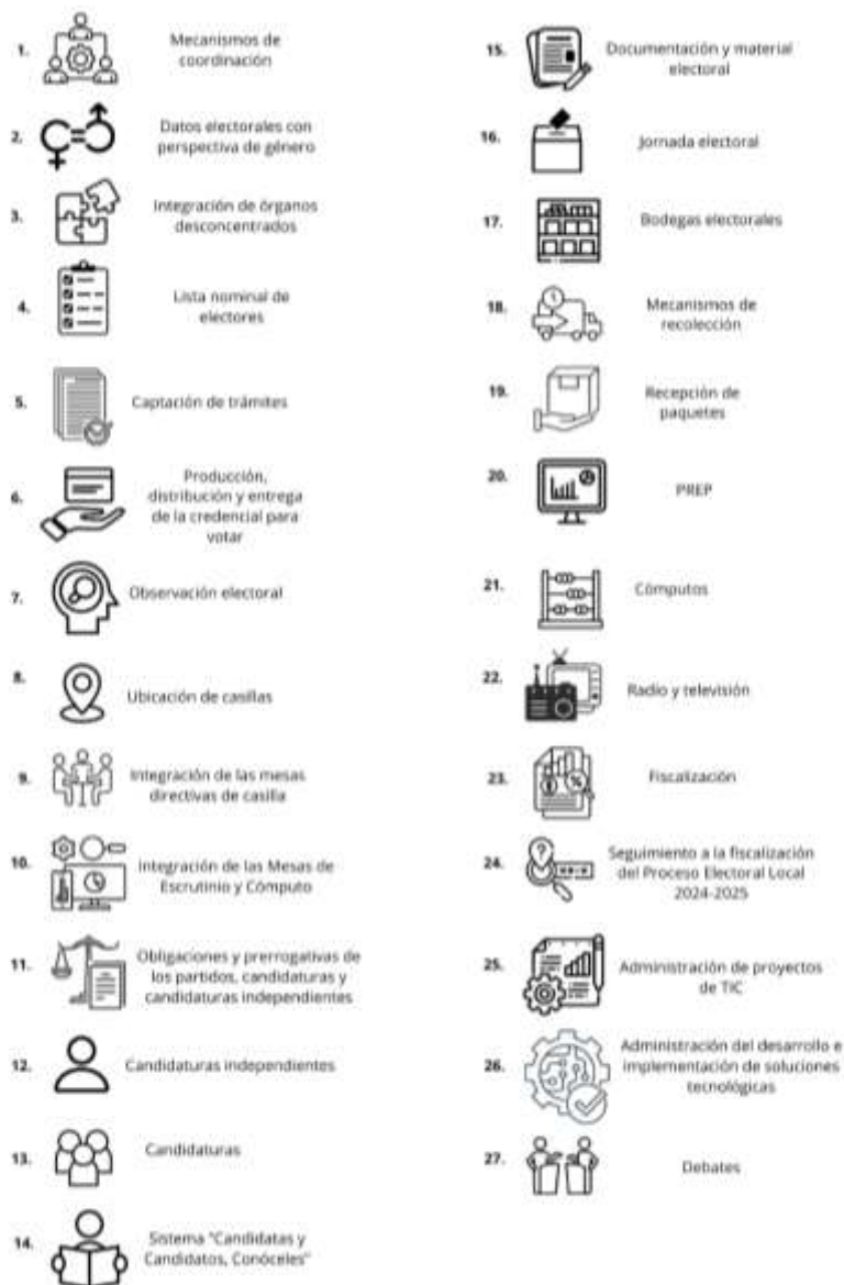
Imagen 2. Subprocesos en el Proceso Electoral Local 2024-2025

Fuente: Calendarios de coordinación PEC 2024-2025