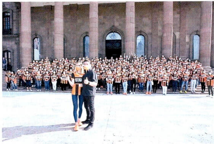
Movimiento Ciudadano tendrá 15 mil representantes de casilla, a quienes bautizó como la "defensa matona".

Con un despliegue de 15 mil representantes de casilla, a quienes bautizó como la "defensa matona", es como Movimiento Ciudadano busca vigilar el voto en las elecciones del 6 de junio.