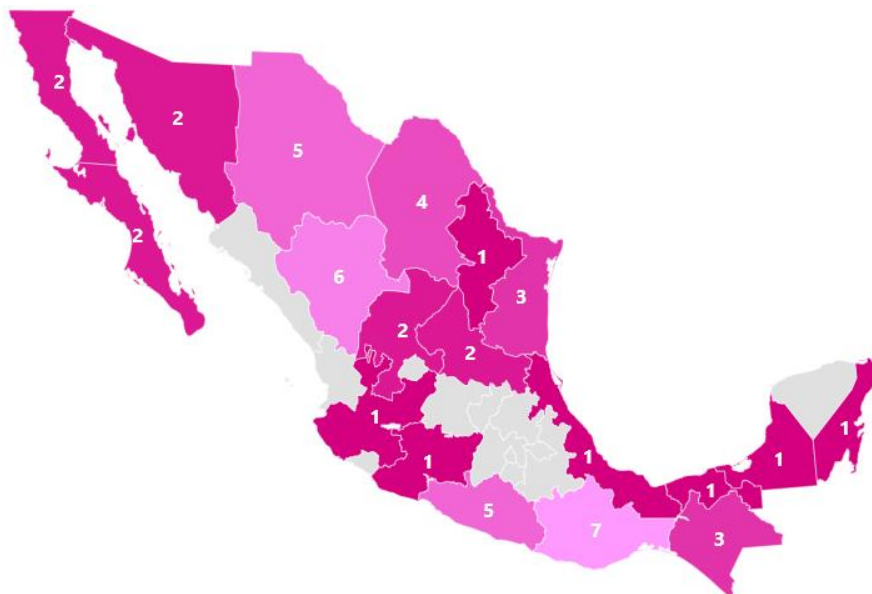
Mapa 1 Proceso Electoral Concurrente 2023-2024 Distribución de las OM por entidad federativa

Fuente: Elaborado con base en la información del Cuadro 1.