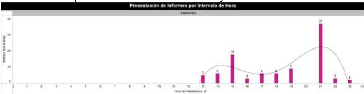
Nota: Universo de informes del Proceso Electoral Local Ordinario 2023-2024 a la fecha de vencimiento