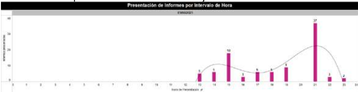
Nota: Universo de informes del Proceso Electoral Local Ordinario 2023-2024 a la fecha de vencimiento

Derivado de las problemáticas presentadas en el Sistema Integral de Fiscalización (SIF), el vencimiento para la presentación del informe correspondiente al último periodo de campaña se extendió inicialmente por 24 horas y, posteriormente, por 36 horas adicionales, concluyendo el 4 de junio a las 11:59 horas (horario local). Lo anterior, en atención a lo establecido en el Plan de Contingencia de la Operación del SIF, el cual contempla el procedimiento aplicable en los casos en que se