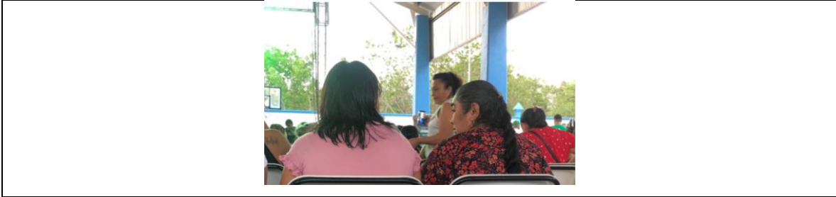
Fotografía 4. Se aprecia en primer plano, la imagen de dos mujeres sentadas en sus respectivas sillas de color blanco y tubos metálicos color negro. Frente a ellas se aprecia a otra mujer de pie, la cual en su mano derecha sostiene una bebida en bote de aluminio, de color azul y gris metálico.

Fotografías que se ofrecen como prueba que se relaciona con todos y cada uno de los hechos contenidos en el apartado marcado como la fracción IV del presente escrito; y, especialmente, con el punto tercero y cuarto, contenidos en el apartado marcado como la fracción V del presente escrito.