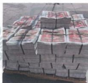
La portada del Impreso, con Claudia Sheinbaum y Alma Alcaraz.

Es importante destacar que la solicitud de acceso al inmueble fue realizada por este medio desde el sábado, sin embargo, los miembros de Morena concedieron la entrada a nuestro medio hasta este domingo.