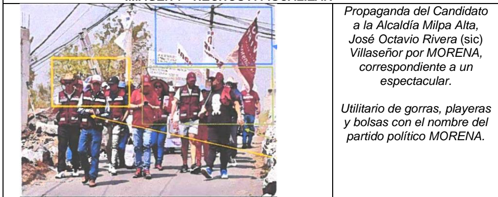
IMAGEN 8 “HECHOS A FISCALIZAR”