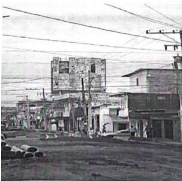
Imagen de donde se denunció la supuesta presencia de propaganda no reportada y en la que se observa que en el domicilio Calle octava oriente # 9 entre 1ª ave Sur y 3ª ave Sur, los naranjos C.P. 30700, Tapachula de Córdova y Ordoñez, Chiapas en la actualidad no existe propaganda alguna, hecho que