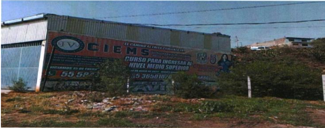
Fotografía 2. Se observa un anuncio de aproximadamente 35 metros de largo y dos metros de ancho; en la parte superior central con letras en color blanco "EL CAMINO AL ÉXITO COMIENZA EN..."; en la siguiente línea con letras en color azul "CIEMS"; a un lado " Centro integral de Educación media Superior Vasconcelos"; en la siguiente línea " CURSO PARA INGRESAR AL NIVEL MEDIA SUPERIOR" en la parte superior izquierdo con letras en color blanco con fondo de color azul "Te enseñaremos a ser competente, a saber resolver tu examen; con estas herramientas te quedaras donde tú decides, si realmente quieres aprender en la siguiente línea "¡¡TE ESPERAMOS!!" en la siguiente línea en letras de color blanco y fondo verde "INICIAMOS 15 DE ENERO / ...." En la siguiente línea tres números telefónicos; en la parte superior derecha dos logotipos de universidades, así como la imagen de una persona de sexo femenino.

Derivado de la no localización de la propaganda descrita en la solitud de Oficialía Electoral, se procedió a realizar el cuestionario a cuando menos tres personas que habiten o usen los inmuebles aledaños a la ubicación.