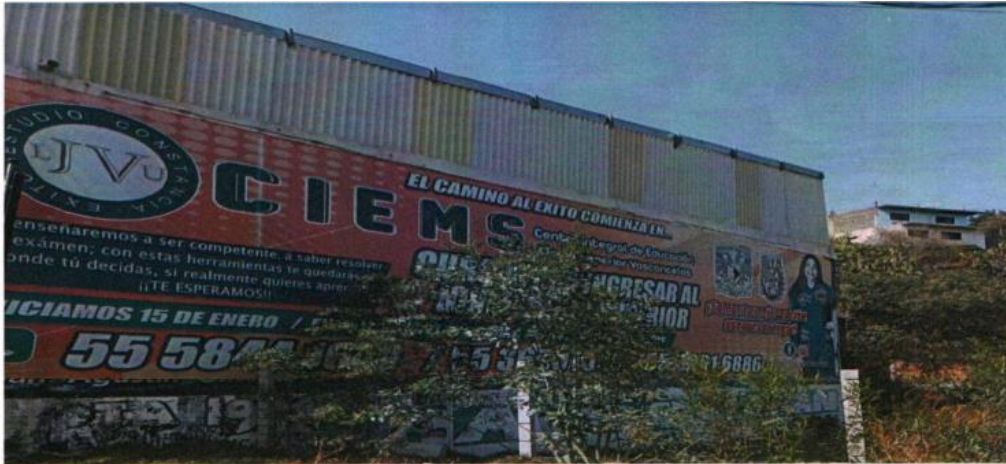
Fotografía 1. Se observa un anuncio de aproximadamente 35 metros de largo y dos metros de ancho; en la parte superior central con letras en color blanco "EL CAMINO AL ÉXITO COMIENZA EN..."; en la siguiente línea con letras en color azul "CIEMS"; a un lado " Centro Integral de Educación media Superior Vasconcelos"; en la siguiente línea " CURSO PARA INGRESAR AL NIVEL MEDIA SUPERIOR" en la parte superior izquierdo con letras en color blanco con fondo de color azul "Te enseñaremos a ser competente, a saber resolver tu examen; con estas herramientas te quedaras donde tú decides, si realmente quieres aprender en la siguiente línea "¡¡TE ESPERAMOS!!" en la siguiente línea en letras de color blanco y fondo verde "INICIAMOS 15 DE ENERO / ...". En la siguiente línea tres números telefónicos; en la parte superior derecha dos logotipos de universidades, así como la imagen de una persona de sexo femenino.

En dicho contexto, se inició el recorrido a pie con dirección de norte a sur, sobre la Carretera San Gregorio-Oaxtepec para certificar la presunta existencia de la propaganda en vía pública y realizar la toma de las fotografías correspondientes, al llegar a la altura de la calle Niños Héroes y la carretera de San Gregorio-Oaxtepec, se observó un lona la cual no corresponde con la propaganda denunciada; de la diligencia a que se refiere este hecho, no se identificó la propaganda denunciada\ se incorporan las siguientes fotografías: