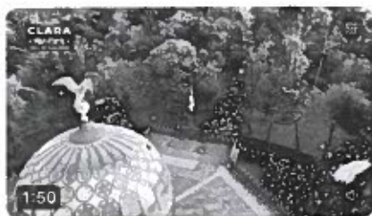
5:08 p.m. · 07/03/24 De Earth · 22.5k visualizaciones

¡Vamos a echar a andar un gran programa de vivienda popular en la Cuauhtémoc! Porque todas y todos merecemos un hogar digno. #LaTransformaciónEsClara #EsTiempoDeMujeres